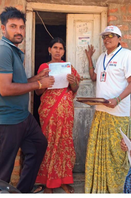
పాల్గొని తమ వివరాలను నమోదు చేసుకోవడం జరుగుతుందని. ప్రతి మండల పరిధి డివిజన్ వారీగా బిఎల్ఓలు సూపర్వైజర్లు తదితరలతో సమావేశాలు నిర్వహించి డిజిటలైజేషన్ గురించే అవగాహన కల్పిస్తూ ఎలా చేయాలి అనే అంశంపై ప్రత్యేక కార్యక్రమాలు నిర్వహించడం జరుగుతుందని తెలిపారు.

మంది, జిల్లా వ్యాప్తంగా వేగంగా ఈ ప్రక్రియను పూర్తి చేయుటకు చర్యలు తీసుకున్నామని, సర్వే కు వెళ్లే ముందు సిబ్బంది ఐడి కార్డు, క్యాష్, వెబ్ సైట్ లో తీసుకుని సర్వే నిర్వహిస్తున్నట్లు కలెక్టర్ తెలిపారు. ఆన్ లైన్ లో ఎన్యూఐఆర్ ఫాం ఫిల్ చేయుటకు ముందు 2002 జూలైలో పేరు కొరకు voters.eci.gov.in ని సందర్శించి పేరు ఈ సైట్ లో యాప్ డౌన్లోడ్ చేసుకొని చూసుకోవచ్చు అని తెలిపారు. ఎన్ఐఆర్ సవరణ ప్రక్రియ కార్యక్రమంలో ఎలా సందేశాలు వచ్చిన బోర్డ్ ఫ్రీ నెంబర్ 1950 సంప్రదించాలని కలెక్టర్ కోరారు. జిల్లాలో 555 పోలీస్ డివిజన్లు గాను 4 లక్షల 84 వేల 935 మంది ఎలక్టోరల్ ఓటరు ఇప్పటివరకు 4 లక్షల, 83 వేల 099 ఎన్యూఐఆర్ ఫాంల పంపిణీ చేయడం పూర్తయిందని, అందులో 47 వేల 535 ఫారాలను పరిశీలించడం జరిగిందని, అందులో 75 మంది ఓటర్లు చనిపోయినట్లుగా గుర్తించగా, 19 మంది ఓటరులు షిఫ్ట్ అయ్యారు. ఎన్ఐఆర్, మ్యాసింగ్ సందేశాలు ఉంటే ప్రత్యేక హెల్ప్ డెస్కులు ఏర్పాటు చేసి, ఓటర్లలో చైతన్యం విస్తృత ప్రచారం కల్పించడం జరుగుతుందని కలెక్టర్ అన్నారు. అత్యంత ప్రాధాన్యత అంశంగా ఈ ఎన్ఐ ఆర్ కార్యక్రమాన్ని ప్రతి ఒక్కరూ తీసుకొని ముందుకు సాగుతున్నారని ప్రతి రోజు ఉదయం, మధ్యాహ్నం, సాయంత్రం పర్యవేక్షిస్తూ తగు సూచనలు సలహాలు జారీ చేయడం జరుగుతుందన్నారు. ప్రతి వారంలో ఒకరోజు అన్ని రాజకీయ పార్టీ ప్రతినిధులతో సమీక్షా సమావేశం నిర్వహిస్తూ వారి సలహాలు సూచనలు తీసుకుంటూ ముందుకు సాగుతున్నామని, ఈ ఎన్ఐఆర్ ప్రక్రియలో స్థానిక శాసనమండలి సభ్యులు, ఎమ్మెల్యేలు, ఎంపీలు, ప్రజాప్రతినిధులు, పుర ప్రముఖులు, ప్రజాప్రతినిధులు, న్యాయ సహాయక బృందాల సభ్యులు, ప్రతి ఒక్కరూ ఉత్సాహంతో