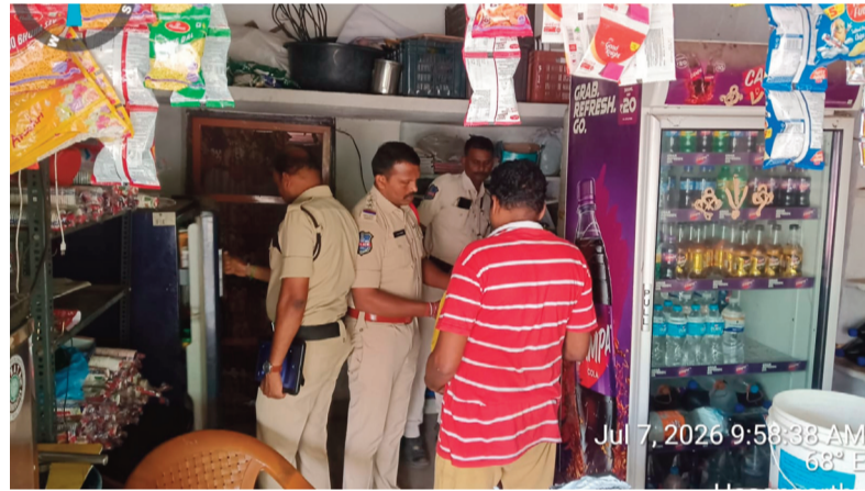
లేదా ఇతర మాదకద్రవ్యాల విక్రయిస్తున్న సమాచారం తెలిసిన వెంటనే పోలీసులకు తెలియజేయాలని ప్రజలకు విజ్ఞప్తి చేశారు. సమాచారం అందించిన వారి వివరాలను పూర్తిగా గోప్యంగా ఉంచుతామని హామీ ఇచ్చారు. ఈ అకస్మిక తనిఖీల్లో హాసన్ పర్తి పోలీస్ స్టేషన్ సిబ్బంది పాల్గొన్నారు.