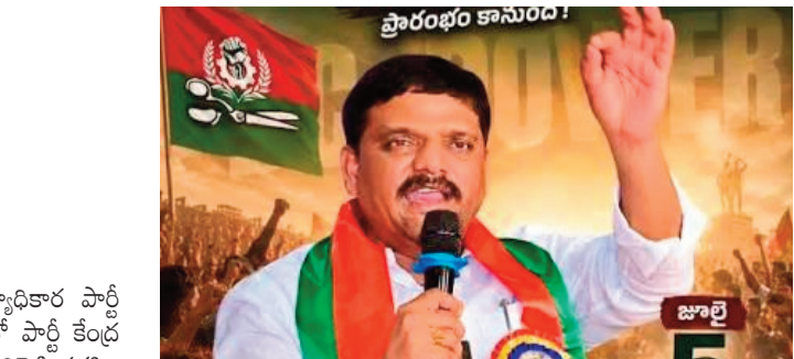
మల్లన్న మాట్లాడుతూ..జూలై 5వ తేదీన భువనగిరి జిల్లా కేంద్రంలో నిర్వహించనున్న 'రాజ్యాధికార సమరభేరి' సభ విజయవంతానికి తీసుకోవాల్సిన