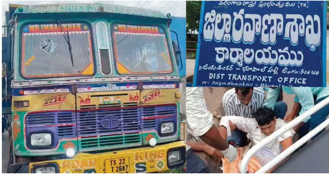
భయాందోళనకు, దిగ్భ్రాంతికి గురయ్యారు. - 15 రోజుల క్రితమే బదిలీపై రాక

-కళ్లముందే నుజ్జునుజ్జులున శరీరం రోడ్డు పక్కన ఆపి ఉంచిన ఒక హార్వెస్టర్ వాహనాన్ని, డీటీఓ కారును డిటీఓ తూ... అక్కడ నిలబడి ఉన్న వెంకన్నపైకి ఆ లారీ దూసుకుపోయింది. ప్రమాద తీవ్రతకు లారీ డ్రైవర్ ఆయనపై నుంచి వెళ్లడంతో వెంకన్న శరీరం మొత్తం నుజ్జునుజ్జులు, తీవ్ర రక్తస్రావంతో ఆయన అక్కడికక్కడే ప్రాణాలు విడిచారు. కళ్లముందే తమ పై అధికారి ప్రాణాలు కోల్పోవడంతో తోటి సిబ్బంది, స్థానికులు తీవ్ర