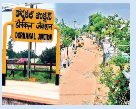
రైల్వే టవర్ పరిసరల్లో అసాంఘిక కార్యకలాపాలు

డోర్ల కల్లో నిర్మించిన బస్ స్టాండ్ ఇప్పటికీ పూర్తిస్థాయిలో వినియోగంలోకి రాకపోవడం ప్రజల్లో అసంతృప్తికి కారణమవుతోంది. లక్షలాది రూపాయల ప్రజాధనం ఖర్చు చేసినప్పటికీ అశించిన ప్రయోజనం లేకపోవడంతో ఇది ప్రభుత్వ నిర్లక్ష్యానికి నిదర్శనంగా మారిందని స్థానికులు అంటున్నారు. ఇదే తరహాలో డోబీఫూల్ నిరాణం పూర్తయినా, కేవలం ఒక ట్రాన్స్ ఫార్మర్ విద్యాలయ చేయకపోవడంతో ప్రారంభానికి నోచుకోకపోవడం విమర్శలకు తావిస్తోంది.