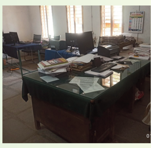
తున్న నేపథ్యంలో సమయపాలన పాటించని అధికారులపై చర్యలు తీసుకోవాలని ప్రజలు డిమాండ్ చేస్తున్నారు.