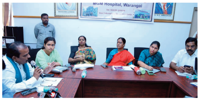
జిల్లా సేవలు అందించాలని సూచించారు. బయోమెట్రిక్ హాజరు తప్పనిసరి