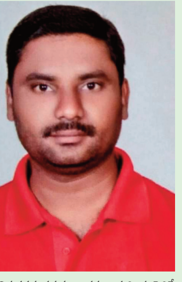
కేసముద్రం, మే20(ప్రభాత గమనం):

కేంద్రంలోని బీజేపీ నేతృత్వంలోని సరేంద్ర మోడీ ప్రభుత్వం ధరలు పెంచి మూడు రోజులు కాకముందే మరోసారి పెట్రోల్, డీజిల్ ధరలను పెంచి సామాన్య ప్రజల నడ్డి విరిచిందని సీపీఐ మండల నాయకులు మంద భాస్కర్ అన్నారు. బుధవారం కేసముద్రం మున్సిపాలిటీ కేంద్రంలో ఒక ప్రకటన విడుదల చేస్తూ పెట్రోల్ డీజిల్ ధరలను ఒక వైపు తగ్గించాలని ప్రజలు ఆందోళన చేస్తుండగా మళ్ళీ ధరలు పెంచడం దారుణం అన్నారు. ఇప్పటికే పెరిగిన నిత్యావసర వస్తువుల ధరలతో ఇబ్బంది పడుతున్న సామాన్యులు తాజాగా పెట్రోల్, డీజిల్ ధరల పెరుగుదలతో పేద, మధ్యతరగతి ప్రజలపై మరింత భారం పెరిగిందని అన్నారు. పెట్రోల్ ధరల పెంపుతో రవాణా నిత్యావసర వస్తువుల ధరలు మరింత పెరిగే అవకాశం ఉందని ఆవేదన వ్యక్తం చేశారు. కార్పొరేట్ వర్గాలకు కేంద్రాల్లోని సరేంద్ర మోడీ ప్రభుత్వం ఊడిగం చేస్తూ పేదల సంక్షేమాన్ని విస్మరిస్తుందని విమర్శించారు. ప్రజా సంక్షేమాన్ని విస్మరించి కార్పొరేట్ శక్తులకు దానోహం అయిందని అన్నారు. పెట్టుబడిదారులకు కార్పొరేట్లకు అనేక రాయితీలున్నా పేద, మధ్యతరగతి ప్రజలపై భారం మోపడం సరేంద్రం కాదన్నారు. ఇది ప్రజా సంక్షేమాన్ని కొరకునే ప్రభుత్వమే లేక ప్రజలను నిలుపు దోపిడీ చేసే ప్రభుత్వమే అని ప్రశ్నించారు. పెంచిన పెట్రోల్, డీజిల్ గ్యాస్ ధరలను తగ్గించకపోతే ప్రజాగ్రహానికి గురికాక తప్పదని హెచ్చరించారు.