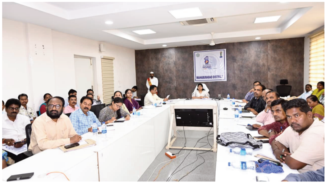
మహబూబాబాద్ మే20(ప్రభాత గమనం):