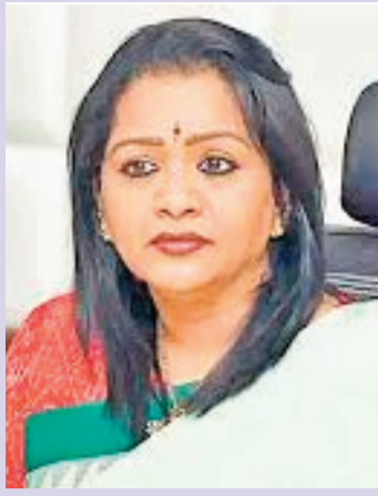
సభ్యులుగా నియమిస్తూ ప్రభుత్వం గెజిట్ విడుదల చేసింది.