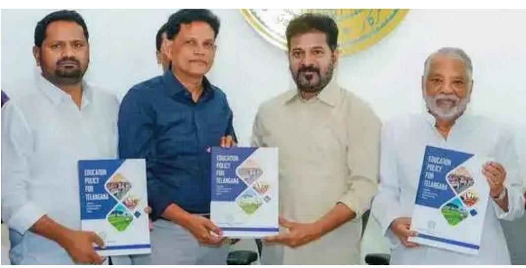
కామన్ బోర్డు ఏర్పాటు చేసి ఛార్జ్..