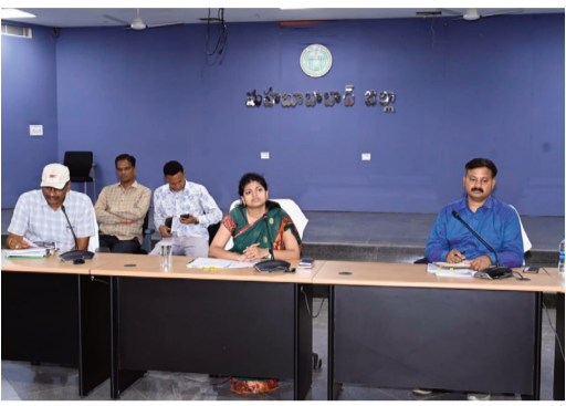
సమన్వయంలో ఎటువంటి లోపాలు చోటుచేసుకోకుండా నిరంతర పర్యవేక్షణ నిర్వహించాలని, గ్రామీణ మరియు పట్టణ ప్రాంతాల్లో సాంకేతిక సహాయం అవసరమైన వారికి తగిన సహకారం అందించాలని సూచించారు. ఎన్యూనెషన్లు, సూపర్వైజర్ల నియామక