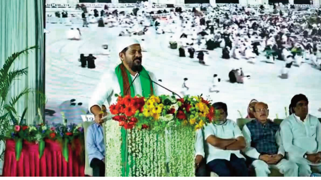
రంగంపై ఆధారపడి ఉన్నారని గుర్తు చేస్తూ.. ఓ.ఆర్.ఆర్ లోపల తిరిగి ఆటోలను ఉచితంగా ఎలక్ట్రిక్ (EV) ఆటోలుగా మార్చేందుకు ప్రణాళికలు సిద్ధం చేస్తున్నట్లు వెల్లడించారు.

రంగంపై ఆధారపడి ఉన్నారని గుర్తు చేస్తూ.. ఓ.ఆర్.ఆర్ లోపల తిరిగి ఆటోలను ఉచితంగా ఎలక్ట్రిక్ (EV) ఆటోలుగా మార్చేందుకు ప్రణాళికలు సిద్ధం చేస్తున్నట్లు వెల్లడించారు. విద్య: ఉపాధిలో కీలక మార్పులు అంతకుముందు సచివాలయంలో నిర్వహించిన సమీక్షలో మై నారిటీ విద్యార్థుల కోసం కీలక ఆదేశాలు జారీ చేశారు. ఐటీఐలను ఏటిసీలుగా అప్ గ్రేడ్ చేసి ఎఐ (AI), నైపుణ్య శిక్షణకు ప్రాధాన్యత ఇవ్వాలి. ఉమ్మడి జిల్లా కేంద్రాల్లో మైనారిటీల కోసం ప్రత్యేక డిగ్రీ కళాశాలలు ఏర్పాటు. టీసీ, ఎస్సీ, ఎస్టీ విద్యార్థుల తరహాలోనే ప్రతిభా వంతులైన మైనారిటీ విద్యార్థులకు ప్రత్యేక ప్రోత్సాహాలు.