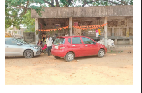
గుతున్న సంబంధిత అధికారులు మాత్రం నిమ్మకు నీరెత్తి నట్లు వ్యవహరిస్తున్నారని ప్రయాణికులు మండిపడుతున్నారు. కనీసం బస్సులు ఆగే ప్రదేశంలో 'సె' పార్కింగ్ బోర్డులు కూడా ఏర్పాటు చేయకపోవడం వారి బాధ్యతారా హిత్యానికి నిదర్శనమని విమర్శిస్తున్నారు. "బస్టాండ్ అవరణ లోకి అవసరమైన ప్రైవేట్ వాహనాలను అనుమతించకూడదు. కక్షణమే సార్కింగ్ జోన్ ను ఏర్పాటు చేసి, నిబంధనలు ఉల్లంఘించే వారిపై కఠిన చర్యలు తీసుకోవాలి. ప్రయాణికుల భద్రత దృష్ట్యా అధికారులు తక్షణమే స్పందించాలి." ప్రజా రవాణా వ్యవస్థను గాడిలో పెట్టాలిని బాధ్యత అధికారులపై ఉంది. మరీ ఇప్పటికైనా గార్ల బస్టాండ్ సమస్యపై అధికారులు దృష్టి సారించి లేదో వేచి చూడాలి.

ప్రభుత్వ బస్టాండ్ అంటే ప్రయాణికులకు రక్షణగా, బస్సులు ఆగేందుకు ఉండాలి. కానీ గార్ల బస్టాండ్ పరిస్థితి ఇందుకు భిన్నంగా ఉంది. ప్రస్తుతం ఈ బస్టాండ్ ప్రైవేట్ వాహనాలకు అడ్డాగా మారిపోయింది. ప్లాట్ ఫాంట్ వద్ద బస్సులు ఆగిపోయిన చోట ఆటోలు, కార్లు, ద్విచక్ర వాహనాలు తిష్ట వేయడంతో సామాన్య ప్రయాణికులు సరకయతన అనుభవిస్తున్నారు. బస్టాండ్ లోపల వాహనాల పార్కింగ్ క్రమబద్ధీకరణ లేకపోవడంతో ప్రయాణికులు బస్సు ఎక్కారంటే సర్వే టిట్లు చేయాలి వస్తోంది. బస్సులు ప్లాట్ ఫాంట్ దూరంగా ఆగకుండా ఉండే ప్రయాణికులు అడ్డంగా ఉన్న ప్రైవేట్ వాహనాల మధ్య నుంచి దూరి బస్సు ఎక్కాలి వస్తోంది. ముఖ్యంగా స్కూలుకు వెళ్లే చిల్లలు, వృద్ధులు ఈ వాహనాల మధ్యలో నడవలేక, బస్సు ఎక్కే క్రమంలో కిందపడిపోయే ప్రమాదం పొంచి ఉందని స్థానికులు అందోళన వ్యక్తం చేస్తున్నారు. బస్సుల రాకపోకలకు అటంకం కలిగిస్తూ ఇష్టానుకూల వాహనాలను నిలిపి ఉంచుతున్నా, అడ్డిగా వారు లేకపోవడంతో వాహనదారుల ఆగడాల మితిమీరిపోతున్నాయి. బస్టాండ్ లోపల ఇంత జరు