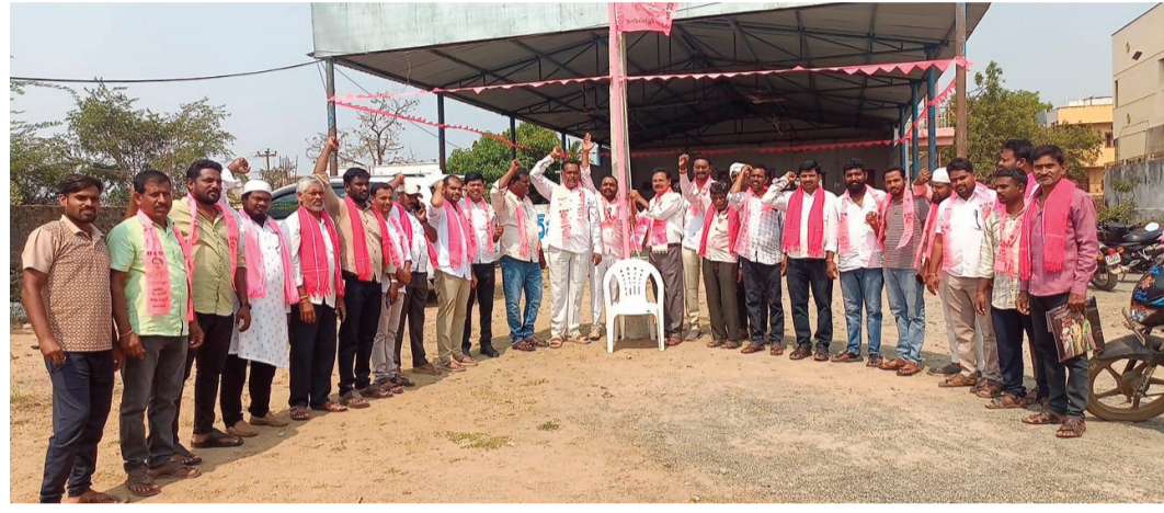
అన్నిస్థానాల్లో ప్రతీక గులాబీ జెండా

బీఆర్ఎస్ ఆవిర్భావ దినోత్సవాన్ని రాష్ట్రవ్యాప్తంగా పార్టీ శ్రేణులు ఘనంగా నిర్వహించాయి. గ్రామాల నుంచి నగరాల వరకు జెండా ఆవిష్కరణలు, ర్యాలీలు, కేక కటింగ్ కార్యక్రమాలు, సేవా కార్యక్రమాలతో వేడుకలు సందడిగా సాగాయి. పార్టీ నాయకులు, కార్యకర్తలు పెద్ద ఎత్తున పాల్గొని బీఆర్ఎస్ అభివృద్ధి పథకాలను గుర్తుచేసుకుంటూ తమ బిక్కుతున్న వ్యవహారాలను, ఈ సందర్భంగా పేదలకు ఆనందం, రక్షణను శిబిరాలు, మొక్కలు నాటడం వంటి కార్యక్రమాలు నిర్వహిస్తూ సామాజిక సేవలోనూ ముందుండాలని నేతలు పిలుపునిచ్చారు.