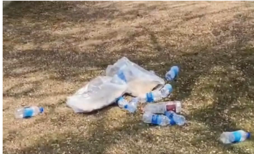
కలెక్టరేట్ గార్డెన్ ప్రాంగణంలో ఎక్కడబడితే లక్కడ వేసిన వాటర్ బాటిల్లు