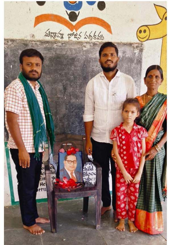
క్యాంప్ తండా గ్రామ పంచాయతీ కార్యాలయంలో..