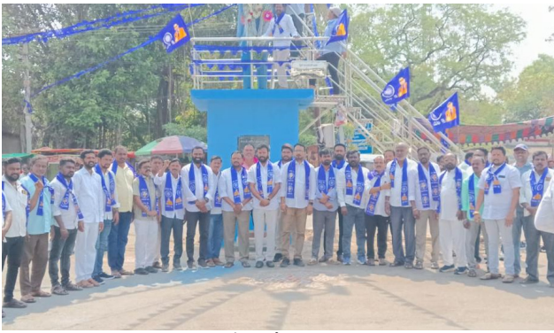
నెక్స్ట్ డల్ అంబేద్కర్ విగ్రహానికి ఘన నివాళి...