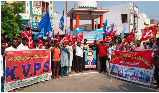
గార్లలో ప్రజాసంఘాల ఆధ్వర్యంలో..