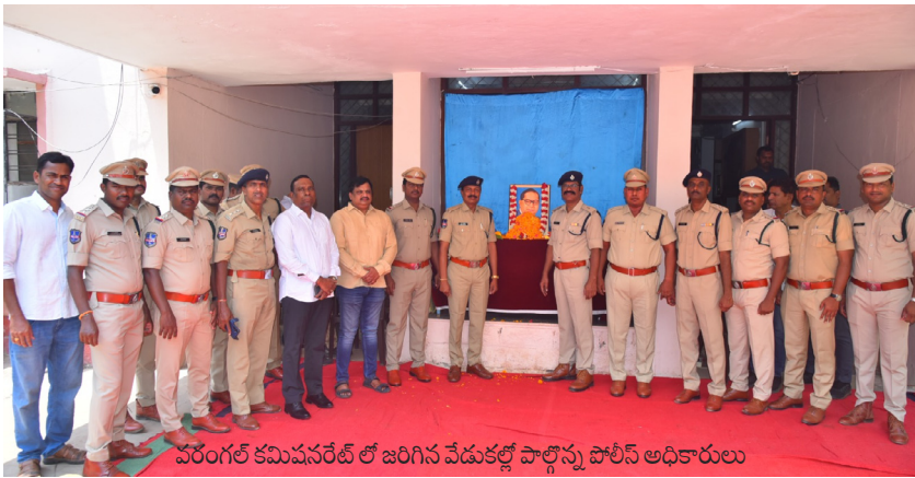
వరంగల్ కమిషనరేట్ లో జరిగిన వేడుకల్లో పాల్గొన్న పోలీస్ అధికారులు