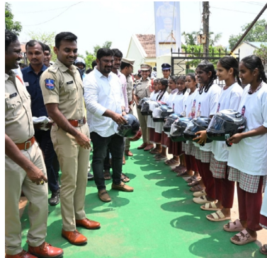
పనిచేస్తాయని పేర్కొన్నారు. గ్రామంలో అనుమా

బయ్యారం, ఏప్రిల్ 9 (ప్రభాత గమనం): గ్రామ ప్రజల భద్రత, నేరాల నియంత్రణ లక్ష్యంగా గంధంపల్లి-కొత్తపేట గ్రామంలో ఏర్పాటు చేసిన సీసీ కెమెరాలను జిల్లా ఎస్సీ శబరీష్ ఘనంగా ప్రారంభించారు. ఈ సందర్భంగా గ్రామంలో శాంతిభద్రతల పరిరక్షణ, రహదారి భద్రతపై ప్రజలకు అవగాహన కార్యక్రమాలు నిర్వహించారు. సీసీ కెమెరాల ప్రారంభానంతరం ఎస్సీ శబరీష్ మాట్లాడుతూ, నేటి కాలంలో సీసీ కెమెరాలు “మూడో కన్ను”లా