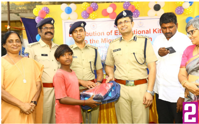
వలస కార్మికుల పిల్లలకు విద్యా కానుక