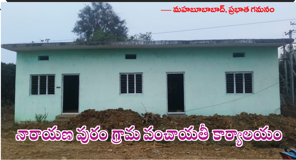
— మహబూబాబాద్, ప్రభాత గమనం