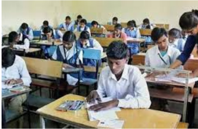
లిపారు జిల్లాలోని అన్ని కేంద్రాలలో పరీక్షలు ప్రశాంతంగా కొనసాగుతున్నాయని జిల్లా విద్యాశాఖ అధికారి తెలిపారు.