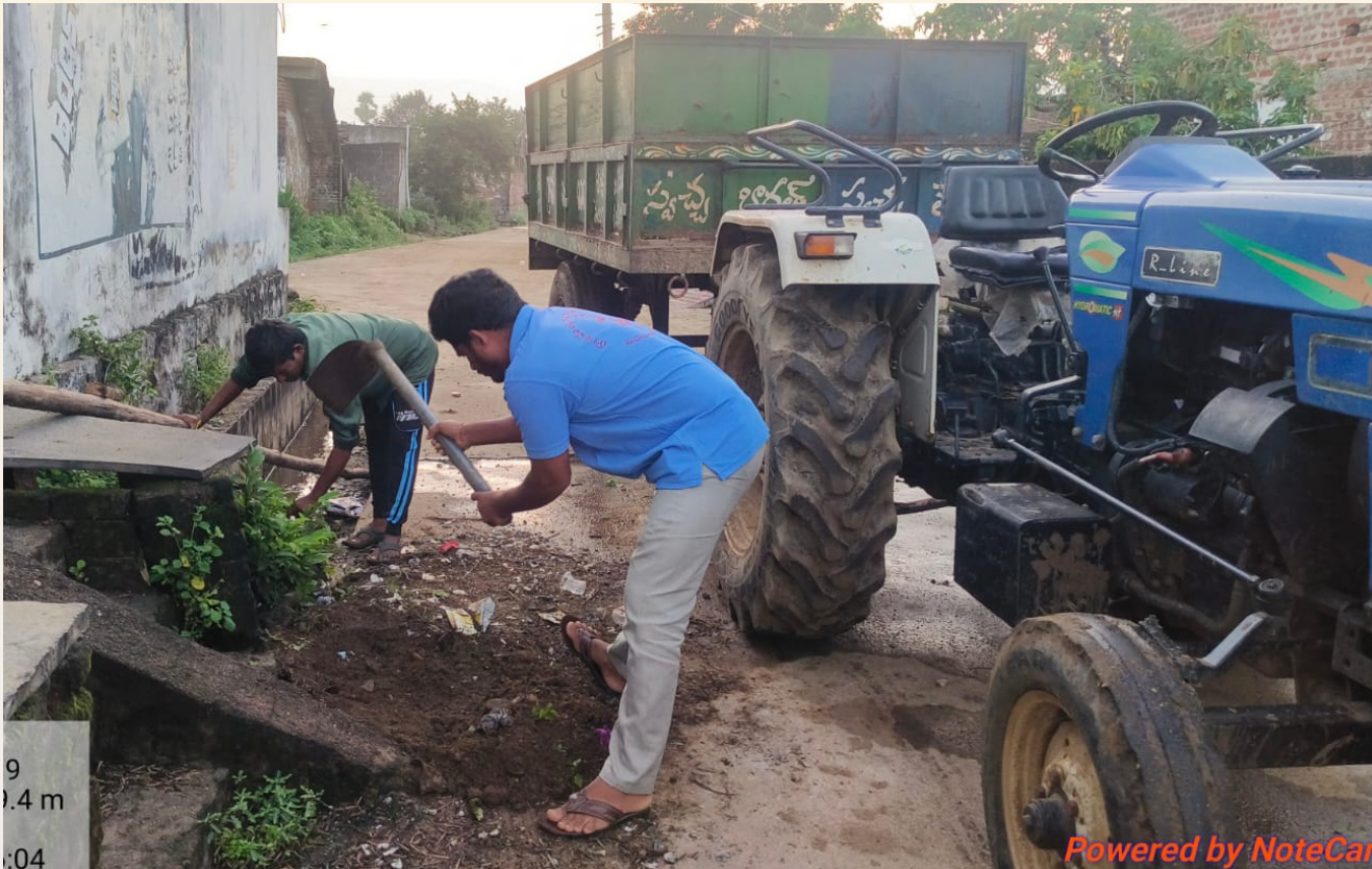
9 .4 m 04