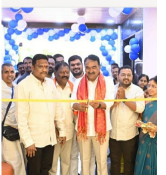
ఇలాంటి సూతన దుకాణాలు దోహదపడతాయని అన్నారు.