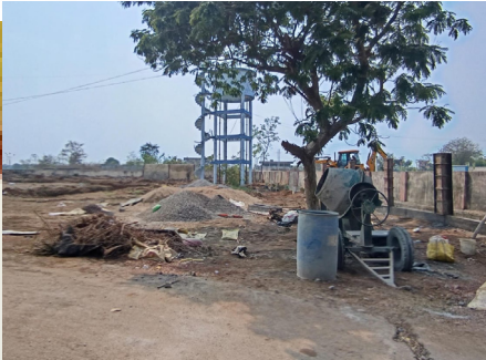
కొనసాగుతున్న 50 పడకల ఆస్పత్రి భవన నిర్మాణం

సునాయాసంగా గెలుస్తామనుకున్న కేసముద్రం మున్సిపాలిటీలో హాంగ్ రావడానికి కౌన్సిలర్ అభ్యర్థుల ఎంపిక ఒక కారణమైతే స్థానిక నాయకత్వ లోపం కూడా ఒక కారణంగా చెప్పుకుంటున్నారు. గెలుస్తాంలే.. అన్న అతి నమ్మకమే నిండా ముంచిందనే వాదనలు వినిపిస్తున్నాయి. అంతేకాక రాష్ట్రప్రభుత్వ సంక్షేమ పథకాలు ప్రజలకు అందించడంలో లోకల్ నాయకులు సాధ్యమై నంత వరకే చేయలేదనే ఆరోపణలు కూడా ఉన్నాయి. అటు వేంపై నమ్మకం ఉన్నా.. లోకల్ లీడర్ల నిర్లక్ష్య వైఖరినే పార్టీలో స్వల్ప ఓటమికి కారణంగా సొంతపార్టీ నేతలే చర్చించుకుంటున్నారు. లోకల్ నాయకత్వం మారనంత కాలం వేం నరేందర్ రెడ్డి లాంటి వాళ్లు ఐదు వందలు కాదు.. వెయ్యి కోట్లతో అభివృద్ధి పనులు చేసినా