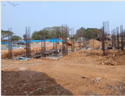
కొనసాగుతున్న డిగ్రీ కాలేజీ భవన నిర్మాణ పనులు