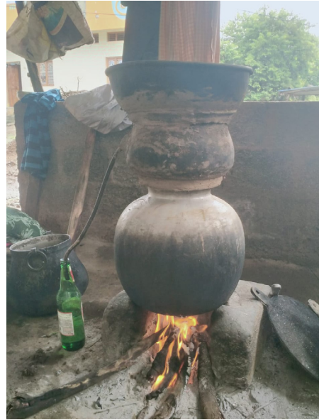
జోరుగా సాగుతున్నాయి. మద్యం తాగాలంటే వందల రూపాయలు వెచ్చించాల్సి వస్తోంది. క్యాటర్ మద్యం కోసాలన్నా రూ.200కు పైగానే ఖర్చవుతోంది. ఇలాంటి

మద్యం ధరలు ఎక్కువగా ఉండడంతో పేద, మధ్య తరగతి వర్గాలకు చెందిన కొందరు మత్తు కోసం సారాకు అలవాటు పడుతున్నట్లు తెలుస్తోంది. దీంతో సారా అమ్మకాలు