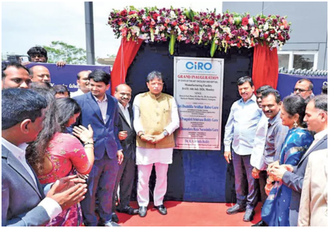
సిద్దిపేట, ములుగు: ఆరోగ్య రంగంలో వేగంగా చోటుచేసుకుంటున్న మార్పులను అవకాశాలుగా అందించుచుకునేలా తెలంగాణను

టన్నుల బొగ్గు రిజర్వ్ ఉన్న ఈ బ్లాక్ ద్వారా.. ఏటా 6 మిలియన్ టన్నుల బొగ్గు ఉత్పత్తి జరుగుతుందన్నారు. దాదాపు 40 నుంచి 50 ఏళ్ల పాటు ఈ గని నుంచి బొగ్గు ఉత్పత్తి జరుగుతుందని చెప్పుకొచ్చారు. దీని ద్వారా మొత్తంగా రూ.64,000 కోట్లకు పైగా రెవెన్యూ వచ్చే అవకాశం ఉందని తెలిపారు. నేరుగా సింగరేణికి ఈ గని ఇవ్వడం ద్వారా అక్షన్ ప్రీమియం చెల్లింపు లోని కారణంగా ఆ సంస్థకు కనీసం రూ.2,550 కోట్లు మిగులుతుందన్నారు. తెలంగాణ ప్రభుత్వానికి రాయల్టీ సహా వివిధ మార్గాల్లో దాదాపు రూ.16 వేల కోట్ల వరకు ఆదాయం సమకూరుతుందని కిషన్ రెడ్డి పేర్కొన్నారు.