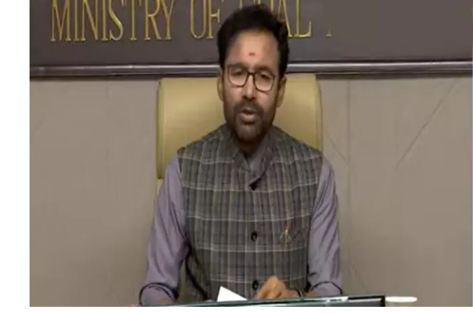
సంవత్సరాలకు సరిపోయే బొగ్గు ఉందని తెలిపారు. ఏటా 10 మిలియన్ టన్నుల బొగ్గు ఉత్పత్తి చేసే అవకాశం సింగరేణికి లభించిందని.. దీని వల్ల సింగరేణికి సుమారు రూ.75 వేల కోట్ల రెవెన్యూ వచ్చే అవకాశం ఉందన్నారు. సింగరేణికి తాడిచర్ల-2 బొగ్గు గనులు కేటాయించామని కిషన్ రెడ్డి తెలిపారు. తాడిచర్ల-2 బొగ్గు గనులపై తుది నిర్ణయం తీసుకున్నామన్నారు. దాదాపు 182 మిలియన్ కిషన్ రెడ్డి పేర్కొన్నారు.

న్యూఢిల్లీ, జూలై 7: దేశాభివృద్ధి విషయంలో సహకార సహజ్య విధానంతో అన్ని రాష్ట్రాల కలిసి ముందుకెళ్లాలని అవసరం ఉందని కేంద్ర బొగ్గు గనుల శాఖ మంత్రి కిషన్ రెడ్డి అన్నారు. మీడియాతో మాట్లాడుతూ.. తెలంగాణ సింగరేణి కోల్ కాలరీస్ లిమిటెడ్(రాఅఅ) అభివృద్ధి విషయంలో కేంద్ర ప్రభుత్వం గత 12 ఏళ్లుగా అన్ని రకాలుగా సహాయ సహకారాలు అందిస్తోందని తెలిపారు. 39 వర్సింగ్ మైన్స్లో 21 అండర్ గ్రౌండ్ మైన్స్, 18 ఓపెన్ కాస్ట్ మైన్స్ ఉన్నాయని.. సుమారు 6 నుంచి 8 జిల్లాల్లో సింగరేణి బొగ్గు గనులు విస్తరించి ఉన్నాయని అన్నారు. లక్షలాది ప్రజల గుండెపప్పును సింగరేణి అని వెల్లడించారు. సింగరేణికి సంబంధించిన మేజర్ మైనింగ్ ప్రాజెక్టుల ఎన్నికలమంట్లో, ఫార్వెస్ట్ క్లియరెన్సీలను వేగవంతం చేయడంలో కేంద్ర ప్రభుత్వం సహకారం అందిస్తోందని కిషన్ రెడ్డి తెలిపారు. తెలంగాణ ఉద్యమంలోనూ సింగరేణి కార్మికులు భాగస్వాములయ్యారని తెలిపారు. కార్మికుల ధైర్యాన్ని తెలంగాణ ప్రజలు ఎన్నటికీ మరిచిపోకూడదు. ఒడిశాలో వైసి కోల్ బ్లాక్ సింగరేణికి వచ్చేలా కృషి చేసినట్లు తెలిపారు. సింగరేణి పురోగతికి తన వంతు సహకారం అందిస్తున్నట్లు చెప్పారు. తెలంగాణతో పాటుగా ఇతర రాష్ట్రాల్లో జరిగే బొగ్గు గనుల వేలంలో పాల్గొనేలా సింగరేణి ప్రయత్నాలు చేస్తోందని తెలిపారు. వైసి కోల్ బ్లాక్లో సుమారు 340 మిలియన్ టన్నుల బొగ్గు రిజర్వ్ ఉన్నాయన్నారు. 30 నుంచి 35