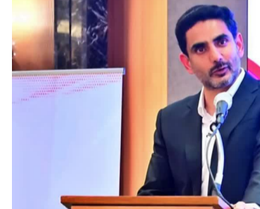
అడుగుపెట్టిన కిరాయి ఫ్యాంట్ పూర్తిస్థాయి అలోమెట్లైల్ ఎకోసిస్టమ్ గా ఏదిగిందని గుర్తుచేశారు. రాల్ యే రోజుల్లో మంత్రి కొరియన్ కంపెనీలతో ఆలాంటి విజయభల లను లిఖిస్తామని లోకేశ్ ఆశంక్షించారు. తెలుగు ప్రజలు ఎక్కడ ఉన్నా ఐక్యంగా ఉండాలన్నదే ప్రభుత్వం ఏర్పాటు ఉద్దేశం. అధికారంలో ఉన్నా లేకపోయినా, తెలుగు సమాజం కోసం కలిసి పనిచేయడమే మా ఉద్దేశం. ఈ ప్రయత్నంలో మనమందరం భాగస్వాములు కావాలి. మీరే మా బ్రాండ్ అంబాసిడర్లు. మన తెలుగు రాష్ట్రాన్ని అభివృద్ధి చేయడానికి మనం కలిసి పనిచేయాలి. అన్ని

ఆంధ్రప్రదేశ్ ప్రగతి ప్రయాణంలో ప్రవాసాంధ్రులే సినలైన బ్రాండ్ అంబాసిడర్లు మంత్రి లోకేశ్ స్పష్టం చేశారు. కిరాయి వంటి మరన్ని విజయవంతమైన పారిశ్రామిక సమాచాలకు ఏపీ కేంద్ర ఆర్థిక మారబోతుందని ధీమా వ్యక్తం చేశారు. వేగం, స్వేచ్ఛ, సేవలే పరమా వధిగా సాగుతున్న కూటమి ప్రభుత్వం '3-ఎస్' పాలనతో రాష్ట్రంలో పెట్టుబడుల విప్లవం రాబోతుందని దక్షిణ కొరియా పర్యటనలో విశ్వాసం వెలిబుచ్చారు. దక్షిణ కొరియా పర్యటనలో భాగంగా సియోల్ లో తెలుగు దయాస్పిరా సమావేశంలో మంత్రి లోకేశ్ కీలక ప్రసంగం చేశారు. ప్రపంచవ్యాప్తంగా ఎక్కడచూసినా తెలుగు నేతలు విజయవంతం కనిపిస్తోందని కొరియా దారు. విదేశాల్లో ఉన్న ప్రతి ప్రవాసాంధ్రుడు ఏపీకి ఒక బ్రాండ్ అంబాసిడర్ అని వారు సాధించే ప్రతి విజయం మాట్లాడుమికి గర్వకారణమన్నారు. ఆంధ్రప్రదేశ్ లో ఉన్న పారదర్శక పాలనను, అపారమైన అవకాశాలను ప్రపంచానికి చాటిచెప్పాలని పిలుపునిచ్చారు. ప్రకృతి వనరుల కంటే కూడా కలిసే శ్రమ, ఆవిష్కరణలు, శాస్త్రీయ దృక్పథంతోనే దేశాలు వృద్ధి చెందుతాయని దక్షిణ కొరియా నిరుపాది చందని లోకేశ్ పేర్కొన్నారు. అనంతపురంలో