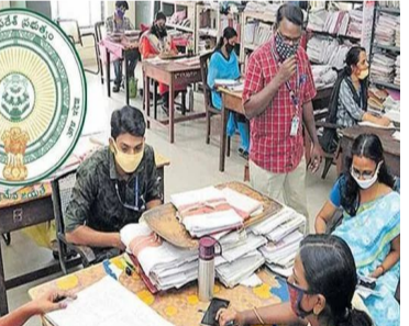
అమరావతిలో తుది పోస్టుల కేటాయింపు ఉత్తర్వులు జారీ చేయనున్నట్లు జీవోలో పేర్కొంది. రాష్ట్ర సచివాలయం, హైద్రాబాద్, డిపార్ట్ మెంట్ (నాణ) కార్యాలయాలు, ఆల్ ఇండియా సర్వీసెస్ అధికారులు, న్యాయశాఖ పోస్టులు, అలాగే పబ్లిక్ సెక్టార్ సంస్థల పోస్టులకు ఈ మార్గదర్శకాలు పంపించిన నిర్ణయం చేసింది. మార్గదర్శకం, పోలవరం జిల్లా లకు తాత్కాలికంగా పోస్టుల కేటాయింపు నకు ప్రభుత్వం అనుమతి ఇచ్చింది. సిబ్బంది కేటాయింపు ప్రక్రియ పూర్తయ్యే వరకు కార్య పోస్టుల సృష్టిపై నిషేధం విధించింది.

అమరావతి, జూలై 6: రాష్ట్ర ప్రభుత్వ ఉద్యోగుల స్థానిక కేంద్రాల ప్రభుత్వం కీలక నిర్ణయం తీసుకుంది. ఉద్యోగుల స్థానిక కేంద్రాలలో పోస్టుల కేటాయింపులకు సంబంధించి మార్గదర్శకాలను విడుదల చేసింది. ఈ మేరకు జీవో ఎంఎన్ నం. 46ను ప్రభుత్వం (సోమవారం) జారీ చేసింది. 2025 రాష్ట్రపతి ఉత్తర్వులకు అనుగుణంగా కేంద్ర బలం నిర్ణయించే విధానాన్ని జీవోలో స్పష్టంగా పేర్కొంది. వర్కంగ్ డ్రాఫ్ట్ పంపిణీకి ప్రత్యేక మార్గదర్శకాలు జారీ చేసింది. రాష్ట్రంలోని 26 జిల్లాలు, 6 జిల్లా, 2 ముఖ్య జిల్లా వారీగా పోస్టుల కేటాయింపు బరగుంది. సేవల అవసరం, పరిపాలనా అవసరాల ఆధారంలో పోస్టుల పంపిణీ జరగాలని ప్రభుత్వం ఆదేశించింది. శాఖల వారీగా పోస్టు అలోకేషన్ రేషియో( రూపొందించి, మండలాల వారీగా అందుబాటులో ఉన్న సేవల డేటాతో నిర్ణయించాలని ఆదేశించింది. అన్ని ప్రభుత్వ శాఖలు ప్రత్యేక ఆన్ లైన్ ప్లాట్ ఫారమ్ ద్వారా తమ ప్రతిపాదనలను సమర్పించాలని ప్రభుత్వం సూచించింది. ఆపై, ఆర్థిక శాఖ