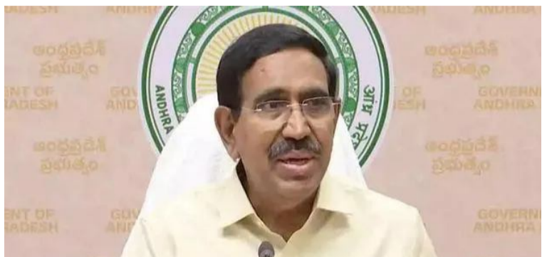
నెల్లూరు, జూలై 6 :

వైసీపీ అధినేత వైఎస్ జగన్ మోహన్ రెడ్డిపై ఏపీ మంత్రి నారాయణ తీవ్ర ఆగ్రహం వ్యక్తం చేశారు. ఏపీలో జరుగుతున్న అభివృద్ధి పనులకు అడ్డుపడితే ప్రజలు సహించరు. మంచి చెడుగా చూపిస్తే, ప్రజలు తగిన గుణపాఠం చెబుతారని హెచ్చరించారు. నెల్లూరులో మంత్రి నారాయణ పర్యటించి, పలు కార్యక్రమాలలో పాల్గొన్నారు. మల్లెల సంజీవయ్య హైస్కూల్, ప్రైవేట్ స్కూల్లో మధ్యాహ్న భోజన నాణ్యతను తనిఖీ చేశారు. ఈ సందర్భంగా ఆయన మీడియాతో మాట్లాడారు. వైసీపీ హయాంలో మూసేసిన వీడియోను కూటమి ప్రభుత్వం అధికారంలోకి