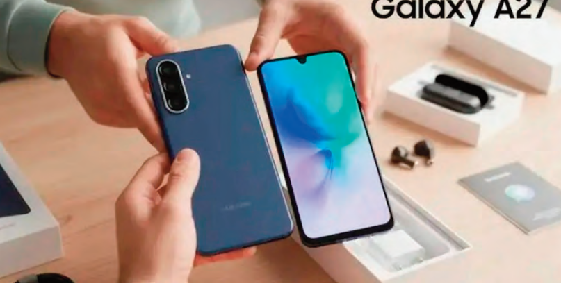
న్యూఢిల్లీ, జూలై 1, 2026

శాంసంగ్ భారత మార్కెట్లో తన కొత్త మిడ్ రేంజ్ స్మార్ట్ ఫోన్ 'గెలాక్సీ ఏ27 5జీ'ను అధికారికంగా విడుదల చేసింది. ఆధునిక ఫీచర్లు, ఆకర్షణీయమైన డిజైన్, దీర్ఘకాలిక సాఫ్ట్ వేర్ అప్ డేట్లతో ఈ ఫోన్ ను తీసుకొచ్చింది. జూలై 3 నుంచి విక్రయాలు ప్రారంభం కానున్నాయి. గత మోడల్ తో పోలిస్తే మెరుగైన పనితీరు, కొత్త కృత్రిమ మేధస్సు ఆధారిత ఫీచర్లను ఇందులో అందించారు.