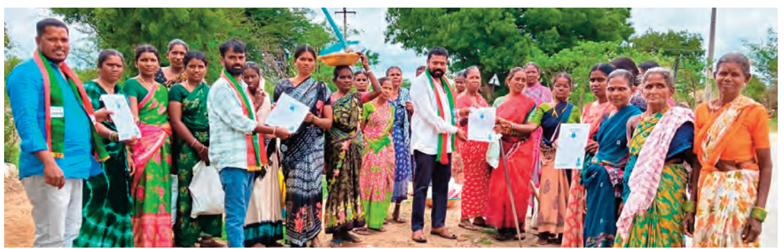
యాదాద్రి భువనగిరి జిల్లా... తుర్రుపల్లి మండలం హలో బస్ ఫలో భువనగిరి రాజ్యాధికార సమరభేరి బహిరంగ సభ ప్రచార కార్యక్రమం లో భాగంగా... వీరారెడ్డిపల్లి గ్రామంలో ఉపాధి హామీ

ఉత్తరప్రదేశ్ లోని ఉన్నావ్ జిల్లాలో బుధవారం తెల్లవారం ఘోర రోడ్డు ప్రమాదం చోటుచేసుకుంది. ఆగ్రా-లక్నో ఎక్స్ ప్రెస్ పై ప్రయాణిస్తున్న స్టీవర్ బస్సు ఎదురుగా వస్తున్న ఎర్లికా కారును ఢీకొని, అనంతరం అదుపుతప్పి రైలింగ్ ను బలంగా ఢీకొట్టి రోడ్డుకు బయట పడిపోయింది. ఈ ప్రమాదంలో ఐదుగురు మృతి చెందగా, మరో ఎనిమిది మంది గాయపడ్డారు. మృతుల్లో ఇద్దరు చిన్నారులు ఉండటం తీవ్ర విషాదాన్ని నింపింది. బంగల్ హావు పోలీస్ స్టేషన్ పరిధిలోని దేవీఖారి గ్రామం సమీపంలో ఉదయం సుమారు 4.30 గంటలకు ఈ ప్రమాదం జరిగింది. హర్యానా నుంచి బీహార్ కు వెళ్తున్న స్టీవర్ బస్సు వేగంగా ప్రయాణిస్తుండగా ఎదురుగా వస్తున్న ఎర్లికా కారును ఢీకొట్టింది. ఢీకొన్న తీవ్రతకు బస్సు అదుపు తప్పి ఎక్స్ ప్రెస్ రక్షణ గోడను బలంగా ఢీకొని రోడ్డుకు బయటకు దూసుకెళ్లింది.