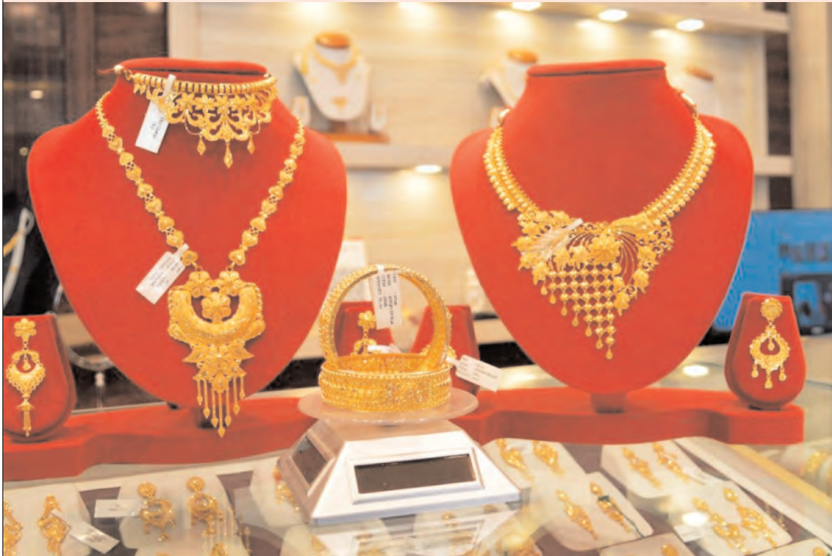
హైదరాబాద్ -- జూలై 01, 2026

పసిడి డిమాండ్ దాదాపు 70 శాతం తగ్గినట్లు మార్కెట్ వర్గాలు అంచనా వేస్తున్న నేపథ్యంలో బంగారం ధరలు స్వల్పంగా తగ్గాయి. పాత బంగారు నగలను విక్రయించేందుకు వినియోగదారులు ఎక్కువగా ముందుకు వస్తుండటంతో మార్కెట్లో డిమాండ్ తగ్గినట్లు వ్యాపారులు చెబుతున్నారు.