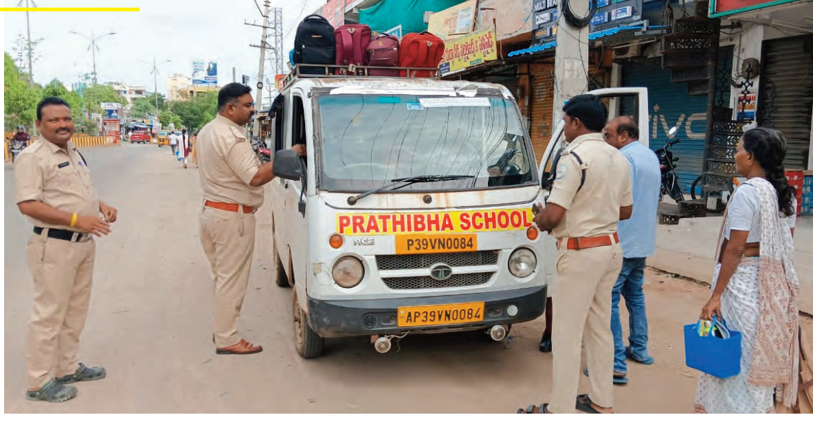
బస్సులను ఏర్పాటు చేయాలని కోరారు. విద్యార్థుల తల్లిదండ్రులు కూడా తమ పిల్లల భద్రత విషయంలో అప్రమత్తంగా ఉండాలని, పరిమితికి మించి విద్యార్థులతో ప్రయాణిస్తున్న వాహనాలను ఉపయోగించకుండా ప్రత్యామ్నాయ ఏర్పాట్లు చేసుకోవాలని అధికారులు విజ్ఞప్తి చేశారు. రవాణా నిబంధనలను ఉల్లంఘించే వాహనాలపై చట్టప్రకారం కఠిన చర్యలు తీసుకుంటామని ఆర్టిఓ అధికారులు హెచ్చరించారు.

సూర్యాపేట, జూలై 1 సూర్యాపేట, కోదాడ ప్రాంతాల్లో పాఠశాల విద్యార్థులను రవాణా చేసే వాహనాలపై ఆర్టిఓ అధికారులు బుధవారం ప్రత్యేక తనిఖీలు నిర్వహించారు. ఈ సందర్భంగా పరిమితికి మించి విద్యార్థులను తరలిస్తున్న పలు ఆటోలను గుర్తించి కేసులు నమోదు చేశారు. ఈ సందర్భంగా ఆర్టిఓ అధికారులు మాట్లాడుతూ, విద్యార్థుల భద్రతే ప్రధాన లక్ష్యంగా ఈ ప్రత్యేక తనిఖీలు చేపట్టామని తెలిపారు. ఇలాంటి తనిఖీలు రానున్న రోజుల్లో కూడా కొనసాగుతాయని పేర్కొన్నారు. ఆటో డ్రైవర్లు, వాహన యజమానులు ఎట్టి పరిస్థితుల్లోనూ పరిమితికి మించి విద్యార్థులను తీసుకెళ్లవద్దని, రహదారి భద్రతా నిబంధనలను తప్పనిసరిగా పాటించాలని సూచించారు. అలాగే వాహనాలకు సంబంధించిన ఫిట్ నెస్ సర్టిఫికేట్, పర్మిట్ తదితర పత్రాలు ఎల్లప్పుడూ చెల్లుబాటులో ఉండేలా చూసుకోవాలని ఆదేశించారు. పాఠశాల యాజమాన్యాలు కూడా ఈ అంశాన్ని అత్యంత బాధ్యతగా తీసుకోవాలని అధికారులు సూచించారు. విద్యార్థుల తల్లిదండ్రులతో సమన్వయం చేసుకుని ఒక ఆటోలో ఐదుగురికి మించి విద్యార్థులను పంపించకుండా చర్యలు తీసుకోవాలని, అవసరమైతే అదనపు వాహనాలు లేదా ప్రత్యేక