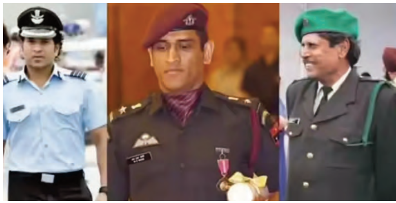
గ్రూప్ కెప్టెన్ గౌరవ హోదాను ప్రధానం చేసింది. ఇక భారత స్టార్ పేసర్ మహమ్మద్ సిరాజ్ కు తెలంగాణ పోలీస్ శాఖ డీఎస్పీ గౌరవ హోదా ఇచ్చింది. అలాగే మాజీ స్పిన్నర్ హర్షజన్ సింగ్, భారత మహిళల జట్టు కెప్టెన్ హర్మన్ ప్రీత్ కార్లకు పంజాబ్ పోలీస్లో డీఎస్పీ హోదాలు లభించాయి. క్రీడల్లో విశేష సేవలందించిన వారికి రాష్ట్ర ప్రభుత్వాలు, రక్షణ దళాలు, పోలీస్ శాఖలు ఇలాంటి గౌరవ హోదాలు ప్రధానం చేస్తుంటాయి. మైదానంలో విజయాలతో దేశానికి కీర్తి తీసుకురావడమే కాకుండా, దేశ సేవకు ప్రతీకలైన గౌరవ హోదాలను అందుకోవడం ద్వారా ఈ క్రికెటర్లు యువతకు స్ఫూర్తిగా నిలుస్తున్నారు. అటల్ క్రమశిక్షణ, జీవితంలో దేశభక్తి కలిపినప్పుడు ఎంతటి గౌరవం దక్కుతుందో ఈ దిగ్గజాల ప్రయాణం మరోసారి చాటి చెబుతోంది.

మైదానంలో ప్రత్యర్థులను చిత్తు చేసి భారత క్రికెట్కు ప్రపంచ స్థాయి గుర్తింపు తీసుకువచ్చిన పలువురు దిగ్గజ ఆటగాళ్లు, దేశ సేవలోనూ తమదైన ముద్ర వేశారు. బ్యాట్, బాల్తో కోట్లాది అభిమానులను సంపాదించిన ఈ స్టార్ క్రికెటర్లకు భారత సైన్యం, పోలీస్ శాఖలు గౌరవ హోదాలు ప్రధానం చేసి గౌరవించింది. క్రమశిక్షణ, దేశభక్తి, సహజ సేవకు గుర్తింపుగా ఈ హోదాలను అందుకున్న వీరు, క్రీడలతో పాటు సేవారంగాలలోనూ ఆదర్శంగా నిలుస్తున్నారు. భారత మాజీ కెప్టెన్ మహేంద్ర సింగ్ ధోనీకి ఇండియన్ టెలికామ్యూనికేషన్లలో ఆర్మీలో టెక్నికల్ కల్చర్ గౌరవ హోదా లభించింది. ధోనీ తన విధుల్లో భాగంగా సైనికులతో కలిసి శిక్షణలో పాల్గొనడం ప్రత్యేకతగా నిలిచింది. 1983 ప్రపంచకప్ విజేత కెప్టెన్ కపిల్ దేవ్ కు కూడా భారత సైన్యంలో టెక్నికల్ కల్చర్ గౌరవ ర్యాంక్ అందించారు. క్రికెట్ దిగ్గజం సచిన్ టెండూల్కర్ కు భారత వైమానిక దళం