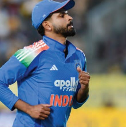
తాను ఇప్పటికే నిరూపించు కున్నారు. ఐపీఎల్లో ఢిల్లీ క్యాపిటల్స్ను పైన లోకు, కోల్కతా నైట్ రైడర్స్ను టైటిల్ విజేతగా, పంజాబ్ కింగ్స్ను పైనలోకు తీసుకెళ్లిన అనుభవం ఆయనకు కలి సొచ్చింది. ఈ అనుభవాన్ని పరిగణలోకి తీసుకున్న బీసీసీఐ, తీ20 జట్టుకు కొత్త కెప్టెన్ గా ఆయనను ఎంపిక చేసింది. ప్రస్తుతం అయ్యర్ నాయకత్వంలోని భారత జట్టు ఐర్లాండ్తో రెండు మ్యాచ్ల తీ20 సిరీస్ ఆడుతోంది. బెల్గామ్లోని సివిల్ సర్వీస్ క్రికెట్ గ్రౌండ్లో తొలి మ్యాచ్ జరుగుతుండగా, ఈ సిరీస్ ఇంగ్లండ్ పర్యటనకు సన్నాహకంగా భావిస్తున్నారు.

టీమిండియా తీ20 జట్టుకు సూతన కెప్టెన్ గా బాధ్యతలు స్వీకరించిన శ్రేయస్ అయ్యర్ తన తొలి మ్యాచ్ ముందే సోషల్ మీడియాలో ఆసక్తికర చర్చకు కారణమయ్యాడు. ఐర్లాండ్లో జరుగుతున్న తొలి తీ20 కౌన్సి గంటల ముందు ఆయన తన ఇన్ స్టాగ్రామ్ బయోను అప్డేట్ చేస్తూ "రెండో పుట్టినతేదీ: 25.12.2025" అనే ఎంట్రీని జతచేశాడు. ఈ మార్పు అభిమానుల్లో, క్రికెట్ వర్గాల్లో తీవ్ర ఆసక్తిని రేపించింది. అయ్యర్ అసలు పుట్టినతేదీ 1994 డిసెంబర్ 6 కాగా, ఈ కొత్త తేదీ వెనుక భావోద్వేగ కారణం ఉందని అంచనా వేస్తున్నారు. గతంలో తీవ్రమైన గాయానికి గురైన తర్వాత పూర్తిగా కోలుకున్న రోజును గుర్తుగా ఆయన ఈ తేదీని 'రెండో జీవితం' ప్రారంభమైన రోజుగా భావించినట్లు అభిప్రాయాలు వ్యక్తమవుతున్నాయి. ఇటీవల ఆస్ట్రేలియాతో జరిగిన వన్డే ఫీల్డింగ్ సమయంలో అయ్యర్ తీవ్రంగా గాయపడి కొంతకాలం ఆటకు దూరమయ్యారు. ప్రాణాంతక పరిస్థితి నుంచి కోలుకుని తిరిగి మైదానంలోకి రావడం ఆయన కెరీర్లో కీలక మలుపుగా నిలిచింది. ఇక నాయకత్వ పరంగా కూడా శ్రేయస్ అయ్యర్ తనను