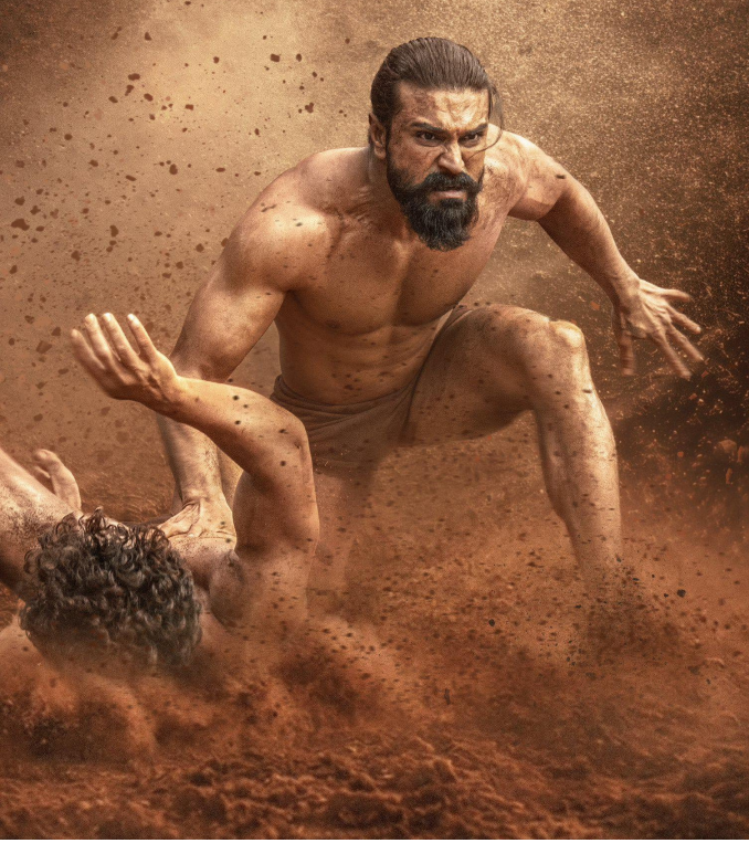
సినిమా నేపథ్యం ఉన్న కుటుంబం నుంచి వచ్చినప్పటికీ.. ప్రేక్షకులు ఎప్పుడూ నటుడి నటన చూసే ఆదరిస్తారని రామ్ చరణ్ అన్నారు. తాజాగా

ప్రేక్షకులు ఊరికే ఆదరిస్తానుకోరాదు నటుడు రామ్ చరణ్