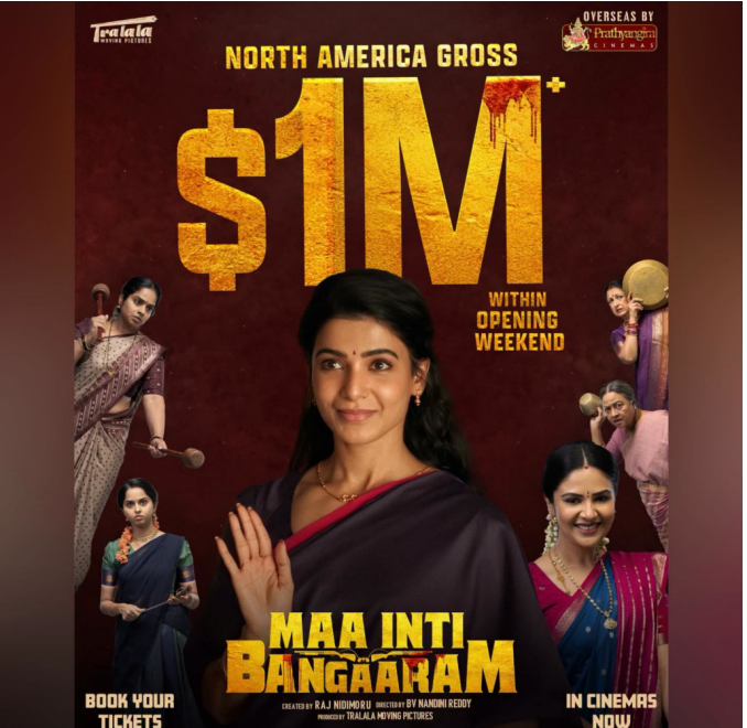
స్టార్ హీరోయిన్ సమంత ప్రధాన పాత్రలో నటించిన 'మా ఇంటి బంగారం' బాక్సాఫీస్ వద్ద అద్భుతమైన వసూళ్లతో డూకుకుపోతోంది. దాదాపు మూడు సంవత్సరాల విరామం తర్వాత సమంత నుంచి వచ్చిన ఈ చిత్రం ప్రేక్షకుల నుంచి విశేష ఆదరణ పొందుతూ విజయపథంలో కొనసాగుతోంది. మొదటి రోజు నుంచే పాజిటివ్ టాకెస్ సొంతం చేసుకున్న ఈ మూవీ, వీకెండ్లో మరింత జోరు చూపించి భారీ కలెక్షన్లను నమోదు చేసింది. సాధారణంగా స్టార్ హీరోల సినిమాలకు కనిపించే స్థాయిలో 'మా ఇంటి బంగారం'కు ప్రేక్షకుల నుంచి స్పందన లభిస్తోంది. మొదటి రోజు మంచి ఓపెనింగ్