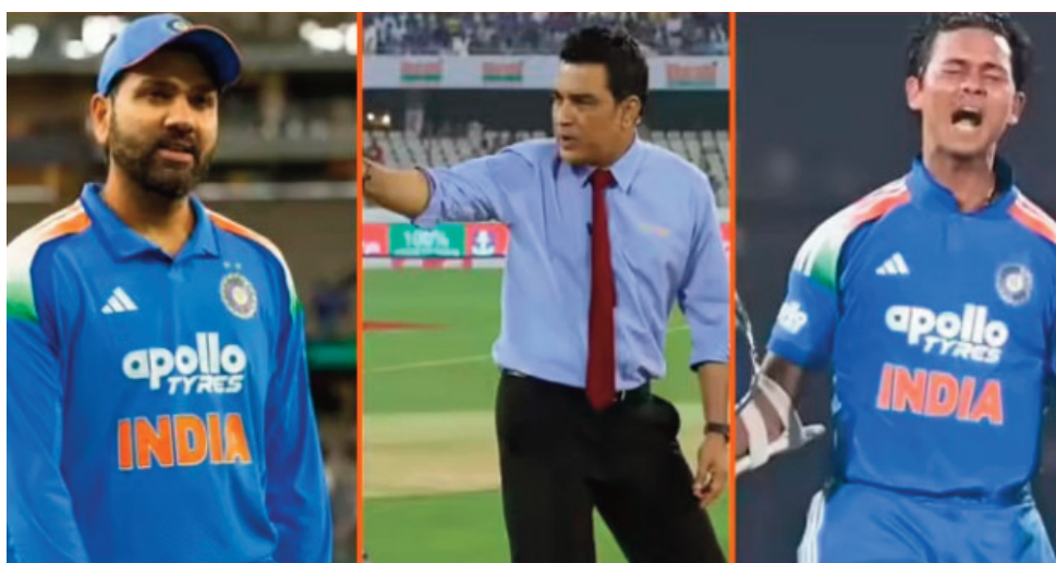
మాత్రమే కూడా స్పష్టత అవసరమని సూచించారు. ఇదే సమయంలో యువ ఆటగాడు వైభవ్ నూర్యవంశీ భవిష్యత్తులో మరింత మెరుగైన ప్రదర్శన ఇవ్వాలని ఆయన ఆకాంక్షించారు.

ఇంగ్లండ్తో జరగనున్న వన్డే సిరీస్ కోసం భారత జట్టును ప్రకటించిన సేపర్లలో సెలక్షన్ నిర్ణయాలపై మాజీ క్రికెటర్, వ్యాఖ్యాత సంజయ్ మంజ్రేకర్ తీవ్ర విమర్శలు చేశారు. ముఖ్యంగా ఫామ్లో ఉన్న యువ ఓపెనర్ యశస్వి జైస్వాల్ను జట్టులోకి తీసుకోకపోవడాన్ని ఆయన ప్రశ్నించారు. మంజ్రేకర్ మాట్లాడుతూ, జైస్వాల్ తన చివరి మూడు వన్డేల్లో అద్భుత ప్రదర్శన చేసినప్పటికీ అతనికి అవకాశం ఇవ్వకపోవడం కఠినమైన నిర్ణయమని అభిప్రాయపడ్డారు. "అలాంటి ఫామ్లో ఉన్న ఆటగాడిని పక్కన పెట్టడం అన్యాయం" అని ఆయన వ్యాఖ్యానించారు. అదే సమయంలో కెప్టెన్ రోహిత్ శర్మ ఎంపికపై కూడా ఆయన పరోక్ష వ్యాఖ్యలు చేశారు. స్టార్ ఆటగాళ్ల ప్రాధాన్యత ఆధారంగా కాకుండా, పూర్తిగా ప్రదర్శన ఆధారంగానే జట్టు ఎంపిక జరగాలని అన్నారు. భారత క్రికెట్లో పెద్ద పేర్ల ప్రభావం ఎక్కువగా ఉండటంపై ఆయన ఆసంతుష్టి వ్యక్తం చేశారు. "సెలక్షన్ అనేది వ్యక్తుల కోసం కాకుండా భారత క్రికెట్ భవిష్యత్తు కోసం ఉండాలి" అని మంజ్రేకర్ స్పష్టం చేశారు. రాబోయే ప్రపంచకప్ ప్రణాళికల్లో రోహిత్