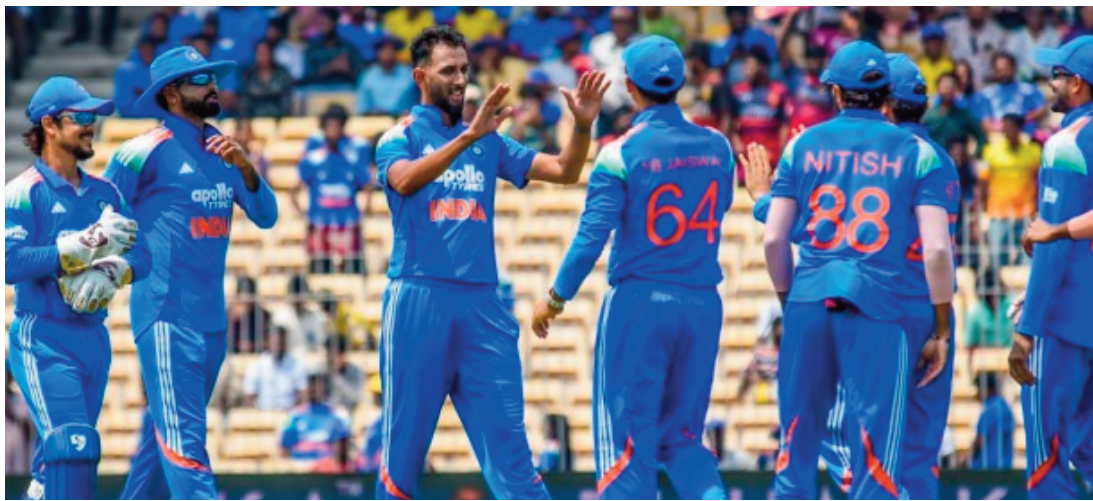
స్వీకరించనుండగా, ఐర్లాండ్ జట్టుకు లోర్డెస్ టకర్ అభిమానులకు రెండు కీలక క్రికెట్ మ్యాచ్లను సజావుగా నాయకత్వం వహించనున్నారు. మ్యాచ్ సమయ మార్పుతో వీక్షించే అవకాశం లభించనుంది.

భారత్--ఐర్లాండ్ మధ్య జరగనున్న రెండు టీ20 అంతర్జాతీయ మ్యాచ్ల ప్రారంభ సమయాల్లో మార్పు చేసినట్లు క్రికెట్ ఐర్లాండ్ ప్రకటించింది. తొలుత సాయంత్రం 7 గంటలకు ప్రారంభం కావాల్సిన మ్యాచ్లు ఇప్పుడు సాయంత్రం 6 గంటలకే ప్రారంభం కానున్నాయి. జూన్ 28న జరగనున్న రెండో టీ20 మ్యాచ్ సమయం, అదే రోజు మహిళల ప్రపంచకప్లో భారత్--ఆస్ట్రేలియా మ్యాచ్తో కలిసిపోవడంతో ఈ నిర్ణయం తీసుకున్నట్లు తెలుస్తోంది. ప్రసార భాగస్వాములతో చర్చల అనంతరం మ్యాచ్ సమయాన్ని ముందుకు మార్చినట్లు అధికారులు వెల్లడించారు. ఈ రెండు మ్యాచ్లు బెల్ఫాస్ట్లోని సివిల్ సర్వీస్ క్రికెట్ క్లబ్ వేదికగా జూన్ 26, 28 తేదీల్లో జరగనున్నాయి. ఈ సీరీస్ ద్వారా శ్రేయస్ అయ్యర్ భారత టీ20 జట్టుకు కొత్త కెప్టెన్గా బాధ్యతలు