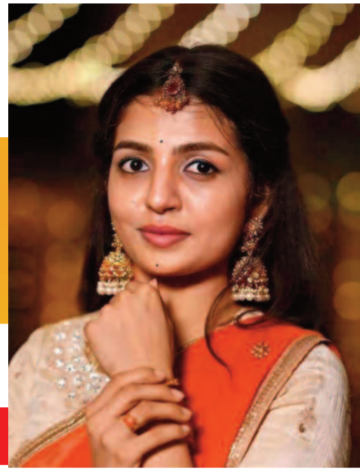
ఫాక్ క్వీన్ నాగదుర్గ టూలివుడ్లో హీరోయిన్గా ఎంట్రీ

హైదరాబాద్ || సంపుటి: 1 || సంచిక: 26 || గురువారం || 25-6-2026 || పేజీలు: 8 || వెల 3/-