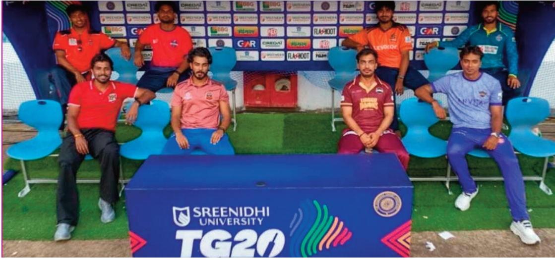
మారింది. ఖమ్మం బౌలర్లు కీలక సమయంలో మలుపు తిరిగింది. చివరికి పాలమూరు జట్టు 6 కట్టుదిట్టంగా బౌలింగ్ చేసి వికెట్లు తీయడంతో మ్యాచ్ వికెట్లకు 217 పరుగులు మాత్రమే చేయగలిగింది.