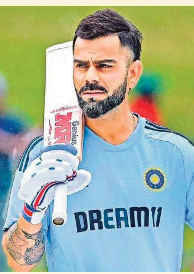
విరాట్ కోహ్లి టెస్ట్ క్రికెట్ పై