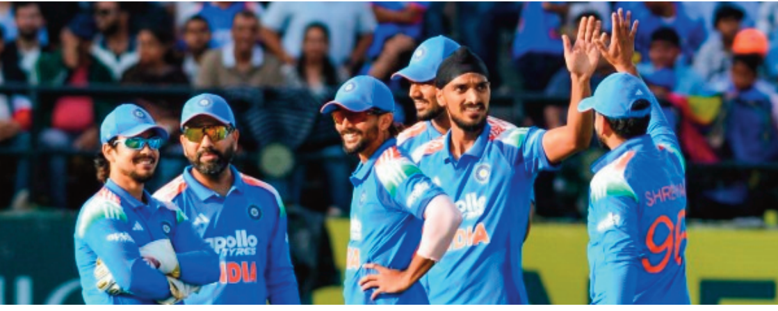
కొత్త దశలోకి అడుగుపెట్టింది. ఇప్పటికే ఆస్ట్రేలియాపై క్లీన్ స్వీప్ సాధించిన భారత్, ఇంగ్లాండ్ సిరీస్ తో తన బలాన్ని మరింత పరిశీలించుకుంది. బీసీసీఐ లక్ష్యం కేవలం తాత్కాలిక విజయాలు కాకుండా, 2027 వరల్డ్ కప్ ను గెలిచే స్థాయి బలమైన జట్టును నిర్మించడం అని స్పష్టం చేసింది.

2023 వచ్చే వరల్డ్ కప్ పై నెలలో ఎదురైన పరాజయం తర్వాత 2027 మెగా టోర్నీని లక్ష్యంగా పెట్టుకుని భారత క్రికెట్ నియంత్రణ మండలి ప్రత్యేక ప్రణాళికలు సిద్ధం చేస్తోంది. బోర్డు ఇప్పటికే కొత్త రోడ్ మ్యాప్ ను రూపొందిస్తూ, సెలెక్షన్లు, కోచింగ్ స్టాఫ్ మధ్య పూర్తి సమన్వయంతో జట్టు నిర్మాణంపై దృష్టి పెట్టినట్లు వెల్లడించింది. భవిష్యత్ అవసరాలను దృష్టిలో ఉంచుకుని ఆటగాళ్ల ఎంపిక, కాంట్రాక్టులు, ప్యాషన్లు రూపొందించడం జరుగుతుంది. ఇంగ్లాండ్ తో జరిగే వచ్చే సిరీస్ ను ఈ ప్రణాళికలో కీలక పరిష్కార భావిస్తున్నారు. ఈ సిరీస్ ద్వారా కొత్త ఆటగాళ్ల ప్రదర్శనను అంచనా వేసి, 2027 వరల్డ్ కప్ కు బలమైన జట్టును తయారు చేయాలని లక్ష్యంగా పెట్టుకున్నారు. భారత జట్టు ఎంపిక కమిటీ చైర్మన్ అజిత్ అగార్వల్, ప్రధాన కోచ్ గాతమ్ గంభీర్ కలిసి జట్టు కూర్పుపై సన్నిహితంగా పనిచేస్తున్నారని సమాచారం. కొత్త వచ్చే కెప్టెన్ గా శుభమన్ గిల్ బాధ్యతలు చేపట్టడంతో, అతని నాయకత్వంలో జట్టు