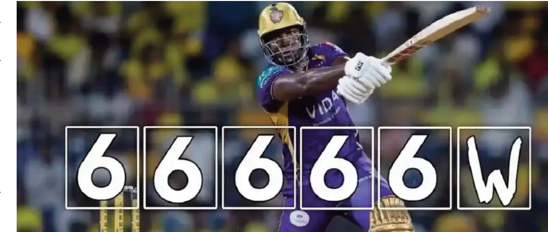
సియాటిల్ ఓర్కాన్స్ జట్టు 115 పరుగులకే రైడర్స్ సులభంగా విజయం సాధించి టోర్నీలో తమ కుప్పకూలింది. బౌలర్ కట్టుదిట్టమైన ప్రదర్శనతో నైట్ స్ట్రైకర్లు బలోపేతం చేసుకుంది.

అమెరికాలో జరుగుతున్న మేజర్ లీగ్ క్రికెట్ (ఎంఎల్ఎస్) టోర్నమెంట్ లో లాస్ ఏంజెలెస్ నైట్ రైడర్స్ జట్టు భారీ విజయాన్ని నమోదు చేసింది. సియాటిల్ ఓర్కాన్స్ పై 81 పరుగుల తేడాతో గెలిచి అభిమానులను ఉర్రూతలూగించింది. ఈ మ్యాచ్ లో వెస్టెండీస్ పవర్ హిట్టర్ రోవ్ మన్ పావెల్ విధ్వంసకర బ్యాటింగ్ తో చెలరేగి పోయాడు. కేవలం 11 బంతుల్లోనే 37 పరుగులు చేసి జట్టు స్కోరును ఆకాశానికెత్తాడు. మ్యాచ్ లో కీలక ఘట్టంగా 17వ ఓవర్ నిలిచింది. శ్రీలంక ఆల్ రౌండర్ దసున్ శనక వేసిన ఆ ఓవర్ లో పావెల్ పరుగుగా ఐదు సిక్సర్లు బాదాడు. ఆ ఒక్క ఓవర్ లోనే 30 పరుగులు వచ్చాయి. పావెల్ దూకుడు తో లాస్ ఏంజెలెస్ నైట్ రైడర్స్ నిర్ణీత 20 ఓవర్లలో 196 పరుగులు చేసింది. అనంతరం లక్ష్మ ఛేదనకు దిగిన