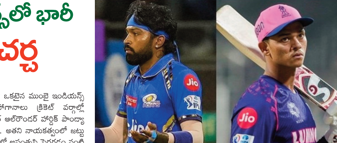
సూర్యకుమార్ యాదవ్ కూడా ముంబై ఇండియన్స్ ను వీడే ఆలోచనలో ఉన్నాడని ఊహాగానాలు వినిపిస్తున్నాయి. కొత్త జట్టు నుంచి అతనికి కెప్టెన్సీ అప్పగించడం కూడా ఉన్నట్లు తెలుస్తోంది. ఈ పరిణామాల మధ్య ముంబై ఇండియన్స్ జట్టు భవిష్యత్ ప్రణాళికలు ఆసక్తికరంగా మారాయి. సీనియర్ ఆటగాళ్ల స్థానంలో కొత్త తరం స్టార్ ప్లేయర్లతో

ఐపీఎల్ లో అత్యంత విజయవంతమైన ప్రాంచైజీలలో ఒకటైన ముంబై ఇండియన్స్ జట్టులో భారీ మార్పులు జరగనున్నాయనే ఊహాగానాలు క్రికెట్ వర్గాల్లో చర్చనీయాంశంగా మారాయి. జట్టు కెప్టెన్ గా ఉన్న స్టార్ ఆల్ రౌండర్ హార్దిక్ పాండ్యా జట్టును వీడే అవకాశం ఉందని వార్తలు వినిపిస్తున్నాయి. అతని నాయకత్వంలో జట్టు ఆశించిన స్థాయిలో రాణించలేకపోవడం, డ్రెస్సింగ్ రూమ్ లో అసంతృప్తి పెరగడం వంటి కారణాలు ఈ నిర్ణయానికి దారితీసినట్లు చెబుతున్నారు. అతని స్థానంలో రాజస్థాన్ రాయల్స్ యువ ఓపెనర్ యశస్వి జైస్వాల్ను ట్రేడ్ ద్వారా తీసుకురావాలని ముంబై యాజమాన్యం ప్రయత్నిస్తున్నట్లు సమాచారం. రాజస్థాన్ జట్టులో ఇటీవల అతని పాత్రపై అనిశ్చితి ఉండటంతో ఈ మార్పు చర్చకు వచ్చింది. అదే సమయంలో స్టార్ బ్యాటర్