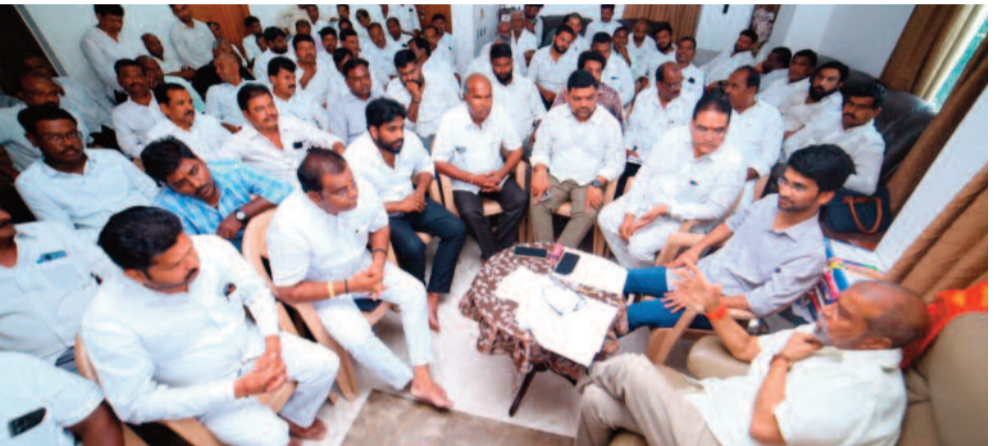
చేపడుతున్న కార్యక్రమాన్ని విజయవంతం చేయడంలో బాత్ లెవెల్ ఏజెంట్ల పాత్ర ఎంతో కీలకమని మంత్రి దామోదర్ రాజనర్సింహ పేర్కొన్నారు. ఈ సమావేశంలో ఆంధ్రోల్ నియోజకవర్గానికి చెందిన కాంగ్రెస్ పార్టీ నాయకులు, ప్రజాప్రతినిధులు, బాత్ లెవెల్ ఏజెంట్లు తదితరులు పాల్గొన్నారు.

ఆంధ్రోల్ నియోజకవర్గంలో జరుగుతున్న స్పెషల్ ఇంటెన్సివ్ రివిజన్ కార్యక్రమంపై ఆంధ్రోల్, పట్నాలి, పుల్లూర్, చౌటూరు మండలాలకు చెందిన బాత్ లెవెల్ ఏజెంట్లతో రాష్ట్ర వైద్య, ఆరోగ్య శాఖ మంత్రి శ్రీ దామోదర్ రాజనర్సింహ సంగారెడ్డిలోని తన నివాసంలో అవగాహన సమావేశం నిర్వహించారు. ఈ సందర్భంగా మంత్రి మాట్లాడుతూ, అర్హతలను ప్రతి ఒక్క పౌరుడు ఓటరుగా సమయానికి అయ్యేలా బాత్ లెవెల్ ఏజెంట్లు ప్రత్యేక శ్రద్ధ తీసుకోవాలని సూచించారు. ఓటర్ల జాబితాలో ఉన్న తప్పులను గుర్తించి సవరణలు చేపట్టేందుకు కృషి చేయాలని, అర్హతలను ఓటరు కూడా జాబితా నుండి తప్పిపోకుండా చూడాలని అన్నారు. ఓటు హక్కు ప్రజాస్వామ్యానికి మూలస్తంభమని పేర్కొన్న మంత్రి గారు, ప్రతి ఓటరులో తమ ఓటు హక్కుపై అవగాహన పెంపొందించే దిశగా బాత్ లెవెల్ ఏజెంట్లు పనిచేయాలని కోరారు. స్పెషల్ ఇంటెన్సివ్ రివిజన్ ప్రక్రియపై ప్రతి ఏజెంట్ పూర్తి అవగాహన కలిగి ఉండాలని, దాని ముఖ్య ఉద్దేశాలను ప్రజలకు వివరించాలని సూచించారు. ఓటర్ల జాబితా పారదర్శకంగా, ఖచ్చితంగా ఉండేందుకు ఎన్నికల సంఘం