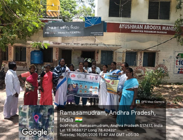
Ramasamudram, Andhra Pradesh, India. 09/11/2026, Ramasamudram, Andhra Pradesh 517417, India. Lat 13.968672° Long 78.42422° Tuesday, 16/06/2026 11:47 AM GMT +05:30