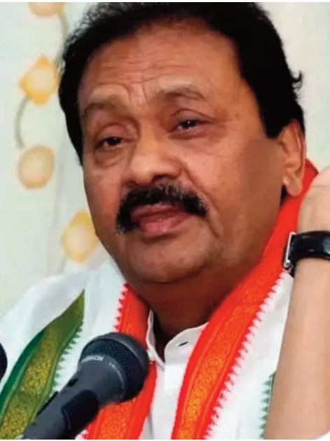
నెలకొన్నాయి. కాంగ్రెస్ అధిష్టానం ఈ పరిణామాలను ఎలా చక్కదిద్దుతుందనేది ఇప్పుడు రాజకీయ పర్లపాఠు ఆసక్తికరంగా మారింది.