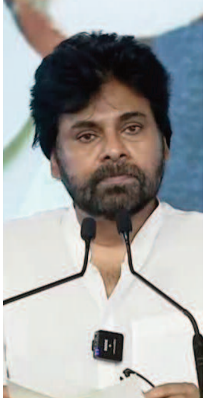
కోల్పోవడం తీవ్ర విషాదకరమని అన్నారు. ఆ దుర్ఘటన పట్ల సంతాపం వ్యక్తం చేస్తూ, తొలుత జూన్ 9న నిర్వహించాల్సిన ఈ కార్యక్రమాన్ని వాయిదా వేసి ఇప్పుడు నిర్వహిస్తున్నామని వివరించారు.

శాతం డ్విక్ రేట్ నమోదు చేసిందన్నారు. ఆ సమయంలో విమర్శించిన వారే ఇప్పుడు ఆశ్చర్యపోతున్నారని వ్యాఖ్యానించారు. ఎన్నికల సమయంలో ప్రజలకు ఇచ్చిన ప్రతి హామీని అమలు చేసే దిశగా ప్రభుత్వం ముందుకు సాగుతోందని తెలిపారు. ప్రజాస్వామ్యంలో అంతిమ న్యాయనిర్ణేతలు ప్రజలేనని పవన్ కల్యాణ్ స్పష్టం చేశారు. ప్రజలు కేవలం ఓటు మాత్రమే వేయరని, చరిత్రను కూడా రాస్తారని అన్నారు. ప్రజలు మౌనంగా కనిపించినా సరైన సమయంలో తమ తీర్పుతో చరిత్రను మార్చగలరని 2024 ఎన్నికలు నిరూపించాయని చెప్పారు. ఆ ఎన్నికల ఫలితాలు రాష్ట్రానికి కొత్త ఆశలు, రాబోయే తరాలకు కొత్త నమ్మకాన్ని ఇచ్చాయని పేర్కొన్నారు. ఈ చారిత్రక విజయానికి కారణమైన ప్రతి ఒక్కరికీ కృతజ్ఞతలు తెలిపారు. జాతీయ రాజకీయాలపై కూడా స్పందించిన పవన్ కల్యాణ్, ప్రధానమంత్రి నరేంద్రమోదీ నాయకత్వాన్ని ప్రశంసించారు. ఎన్నో భాగస్వామ్య పక్షాల సమిష్టి కృషితో విశాఖ స్టీల్ ప్లాంట్ ప్రైవేటీకరణను అడ్డుకోగలిగామని పేర్కొన్నారు. అయితే ఇటీవల స్టీల్ ప్లాంట్లో జరిగిన ప్రమాదంలో ఎనిమిది మంది ప్రాణాలు