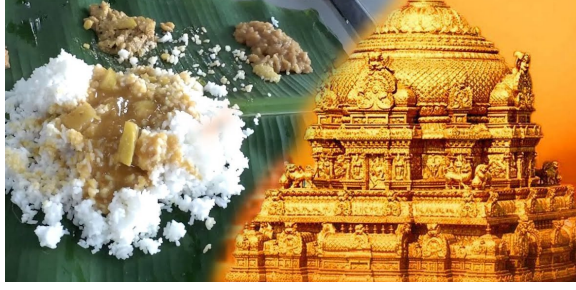
ట్రస్ట్ భక్తుల విరాళాలతో నిర్వహిస్తున్నారు. టీటీడీ దగ్గర ప్రస్తుతం రూ.2,500 కోట్లకు పైగా ఫిఫ్టీ డిపాజిట్లు ఉన్నాయి. ఈ నిధుల ఆదాయంతో లక్షలాది మంది భక్తులకు నిత్యం ఉచితంగా నాణ్యమైన భోజనం అందిస్తోంది. శ్రీవారి సన్నిధిలో ఆకలితో వచ్చే ప్రతి భక్తునికీ తృప్తికరమైన భోజనం అందించడం ద్వారా టీటీడీ అన్నప్రసాద సేవలు ప్రపంచవ్యాప్తంగా ఆదర్శంగా నిలుస్తున్నాయి. టీటీడీ భక్తులకు నాణ్యమైన ఆహారం అందించేందుకు రోజుకు సుమారు

తిరుమల జూన్ 12, తిరుమల శ్రీవారి భక్తులకు టీటీడీ నిత్యాన్నదానం కార్యక్రమం అక్షయ పాత్రలా మారింది. అన్నప్రసాద సేవ 15.8 టన్నుల బియ్యంతో నిత్యం మహాయజ్ఞలా కొనసాగుతోంది. రోజుకు దాదాపు 3 లక్షల మందికి అన్నప్రసాదం అందిస్తున్నారు. 2026 జనవరి నుంచి మే వరకు 4.40 కోట్లకు పైగా సర్వీస్ చేశారు. ఆధునికరణతో విస్తరిస్తున్న అన్న ప్రసాద సేవలు నిర్వహిస్తున్నారు. అన్న ప్రసాదం (ట్రస్టుకు రూ.2,460 కోట్ల ఫిఫ్టీ డిపాజిట్లు ఉన్నాయి.తిరుమల శ్రీవారిని దర్శించుకోవడానికి నిత్యం వచ్చే భక్తులకు టీటీడీ శ్రీ వేంకటేశ్వర అన్నప్రసాదం (ట్రస్ట్ ద్వారా ఉచిత అన్నదానం కార్యక్రమాన్ని నిత్యం మహాయజ్ఞంలా నిర్వహిస్తోంది. నిత్యం దేశ విదేశాల నుంచి తిరుమలకు విచ్చేసే లక్షలాది మంది భక్తులకు నాణ్యమైన, రుచికరమైన భోజనాన్ని టీటీడీ ఉచితంగా అందిస్తోంది. తిరుమలలో 1985 ఏప్రిల్ 6న ప్రారంభమైన నిత్య అన్నదానం పథకం ప్రస్తుతం శ్రీ వేంకటేశ్వర అన్నప్రసాదం (ట్రస్ట్ ఆధ్వర్యంలో కొనసాగుతోంది. తిరుమలలో సాధారణ రోజుల్లో సుమారు 1.80 లక్షల నుంచి 1.90 లక్షల మంది భక్తులు అన్నప్రసాదం స్వీకరిస్తారు.. అదే ఏకెండ్ అయితే 3 లక్షలకు మించి భక్తులు ఉంటారు.శ్రీ వేంకటేశ్వర అన్నప్రసాదం