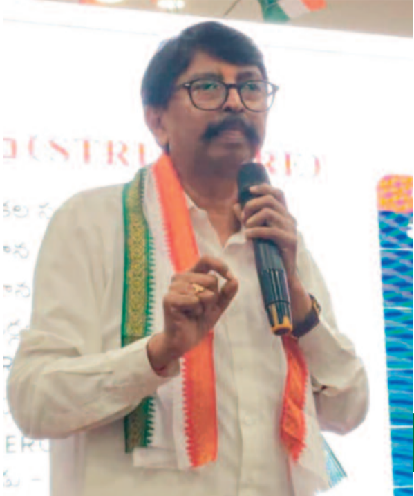
సూర్యాపేట జూన్ 11