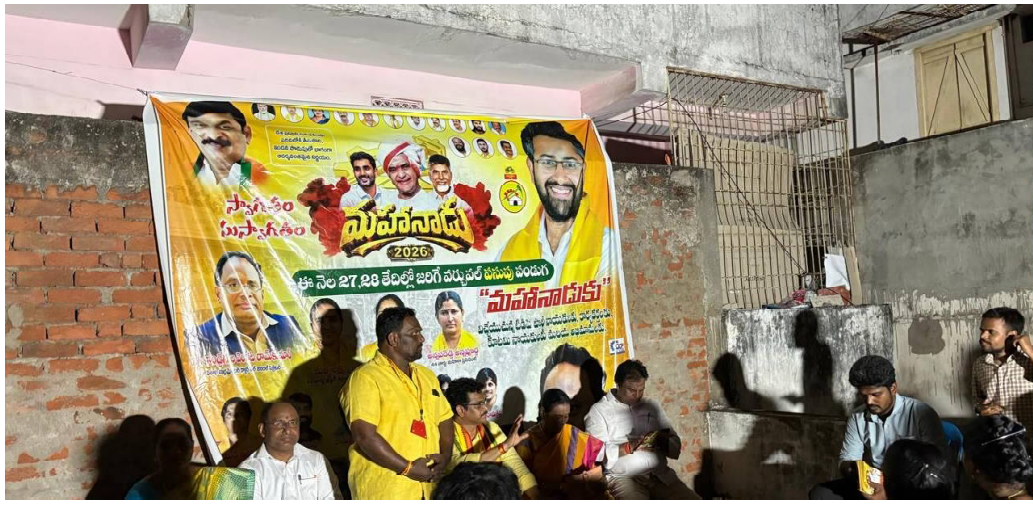
విశాఖపట్నం, (కింగ్ )