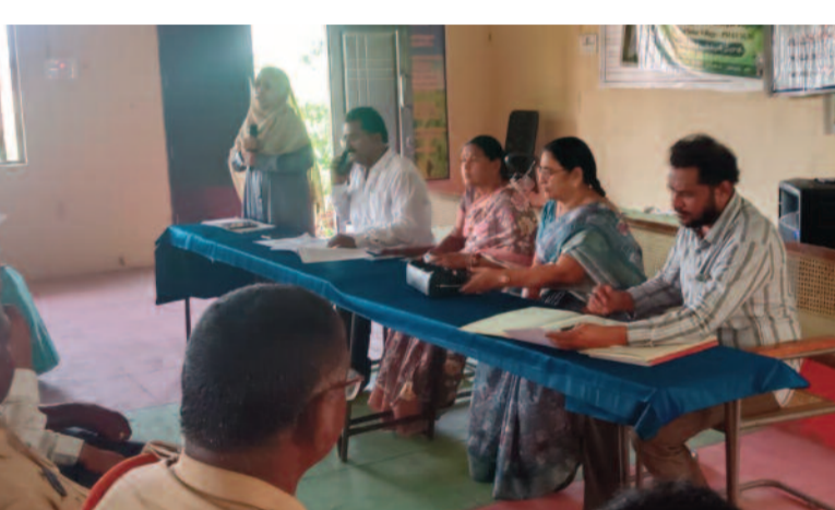
ప్రభుత్వ రాయితీలు: విత్తన సబ్సిడీ, ఉద్యాన రాయితీలను రైతులు పూర్తిస్థాయిలో పంటల సాగుకు ప్రభుత్వం కల్పిస్తున్న సర్వీసులను గాంచేసుకోవాలని కోరారు.

పంటల మార్పిడి: రైతులు సంప్రదాయ పంటలకే పరిమితం కాకుండా, వర్షపాతానికి అనుగుణంగా పంట మార్పిడి పద్ధతులను పాటించాలని సూచించారు.