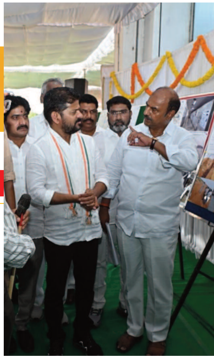
గద్వాల, జూన్ 04: మక్తల్ నారాయణపేట కొడంగల్ ఎత్తిపోతలలో పాటు జవహర్ నెట్టంపాడు ప్రాజెక్టు పరిధిలోని గుడ్డెండాడ్డి పంపు హౌస్ పనులను ఆయన స్వయంగా పరిశీలించి అధికారులకు కీలక ఆదేశాలు జారీ చేశారు. నారాయణపేట జిల్లా మక్తల్ చేరుకున్న ముఖ్యమంత్రి కార్యక్రమాలపల్లె పరిధిలో కొనసాగుతున్న ఎత్తిపోతల తరువాతి 2 వ పేజీలో...

హైదరాబాద్ || సంపుటి: 1 || సంచిక: 6 || శుక్రవారం || 5-6-2026 || పేజీలు: 8 || వెల 3/-