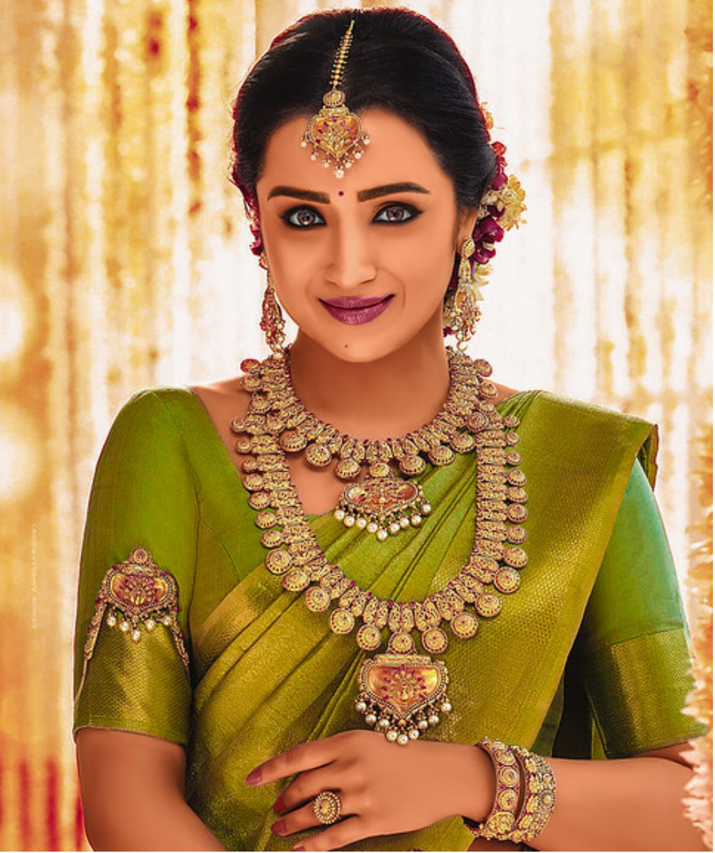
స్టార్ హీరోయిన్ త్రిష తాజాగా ఇన్స్టాగ్రామ్లో షేర్ చేసిన ఫోటోలు సోషల్ మీడియాలో చర్చనీయాంశంగా మారాయి. తనకు ఎంతో ఇష్టమైన 'మ్యూజికల్ మే' నెల జ్ఞాపకాలను, ఫోటోలను అభిమానులతో పంచుకున్నారు. "40 ఏళ్ల వయసులో 25 ఏళ్ల అమ్మాయిలా కనిపించడం గొప్ప కాదు.. 20 ఏళ్ల వయసులో ఉన్న యువతులు 40 ఏళ్ల ప్రాయాన్ని చూసి భయపడకుండా, ఆ వయసు కోసం ఎంతో ఆసక్తిగా ఎదురుచూసేలా చేయడమే నా లక్ష్యం" అనే వ్యాఖ్యను కూడా జత చేశారు. దీంతో అది చూసిన వారంతా విజయ్ సీఎం అవ్వడంతో మ్యూజికల్ మే అని క్యాప్షన్ పెట్టారని చర్చించుకుంటున్నారు. వీరి రిలేషన్ పై ఈ పోస్ట్ తో హిట్ ఇచ్చారని అంటున్నారు.