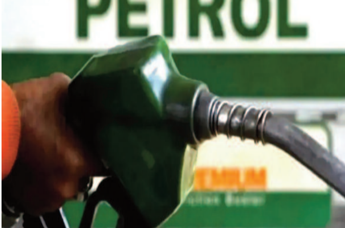
ఎల్పీజీ, ఎగుమతుల్లో తగ్గుదల

భారత ఇంధన మార్కెట్లో ఇటీవలి కాలంలో గణనీయమైన మార్పులు చోటుచేసుకుంటున్నాయి. పెట్రోలియం ప్రణాళిక మరియు విశ్లేషణ విభాగం విడుదల చేసిన తాజా గణాంకాల ప్రకారం, దేశంలో డీజిల్తో పోలిస్తే పెట్రోల్ వినియోగం వేగంగా పెరుగుతోంది. 2026 మే నెల నాటికి పెట్రోల్ డిమాండ్ వార్షిక ప్రాతిపదికన 2.8 శాతం పెరిగి 3,888 వేల మెట్రిక్ టన్నులకు చేరుకుంది.