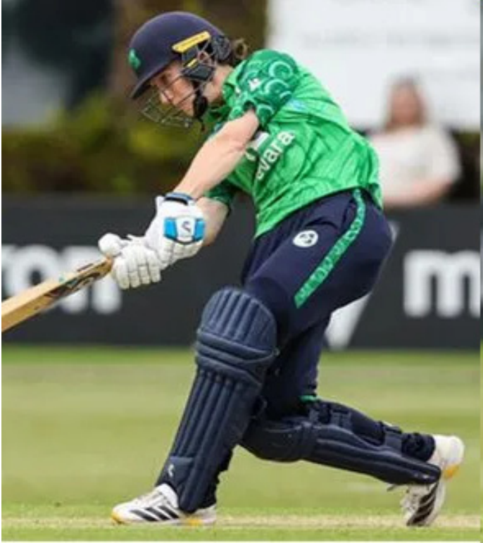
వెస్టిండీస్ మహిళల జట్టుకు ఐర్లాండ్ ఊహించని షాకిచ్చింది. ట్రై సిరీస్లో భాగంగా డబ్లిన్ వేదికగా జరిగిన విండీస్తో జరిగిన మ్యాచ్లో డక్ వర్త లూయిస్ పద్ధతిలో ఒక్క పరుగు తేడాతో ఐర్లాండ్ విజయం సాధించింది. మహిళల టీ20లో వెస్టిండీస్పై ఐర్లాండ్కు ఇదే తొలి విజయం కావడం