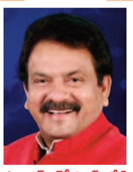
ప్రాఫుల్ల కుమార్ సింగ్ భగత్ కేంద్ర పంచాయతీరాజ్ శాఖ సహాయ మంత్రి

పరిపాలనా సంస్కరణలు- ప్రజా ఫిర్యాదుల విభాగం ఏర్పాటు చేసిన 'జాతీయ ఈ-గవర్నెన్స్ పురస్కారాలు'.. సాంకేతిక ఆధారిత సేవలందించడంలో దేశంలోనే అత్యున్నత ప్రమాణాలకు ప్రతికలుగా నిలుస్తాయి. ఈ ఏడాది 7 విభాగాల్లో ఎంపికైన మొత్తం 17 ప్రాజెక్టుల్లో 4 ప్రాజెక్టులు పంచాయతీ రాజ్ రంగానికి చెందినవి కావడం విశేషం. గ్రామీణ స్థాయిలో సరికొత్త అవిచ్ఛరణలకు అనువైన వాతావరణాన్ని కల్పించేందుకు గత పన్నెండేళ్లు గా నిరంతరం చేసిన కృషి, పెట్టుబడుల సహజ ఫలితమే ఇది. మ పంచాయతీల పనితీరును అంచనా వేయడానికి పంచాయతీ రాజ్ మంత్రిత్వ శాఖ రూపొందించిన అత్యున్నత సాధనం 'పంచాయతీ అడ్వాన్స్‌మెంట్ ఇండెక్స్'. ఇది డేటా అనలిటిక్స్ ద్వారా డిజిటల్ పరివర్తన సాధించినందుకు ప్రతిష్ఠాత్మక 'గోల్డ్ అవార్డు'ను కైవసం చేసుకుంది. ఈ విధానాన్ని తీసుకురావడానికి ముందు దేశవ్యాప్తంగా ఉన్న 2.5 లక్షలకు పైగా గ్రామ పంచాయతీల పనితీరును అంచనా వేయడానికి ఎలాంటి ప్రామాణికమైన, డేటా ఆధారిత వ్యవస్థ లేదు. కానీ నేడు ఇది డేటా, పనితీరు, గుర్తింపు, సామాజిక భాగస్వామ్యాలను అనుసంధానిస్తూ ఒక పారదర్శకమైన అభిప్రాయ సేకరణ వ్యవస్థను సృష్టించింది. రెండు గ్రామ