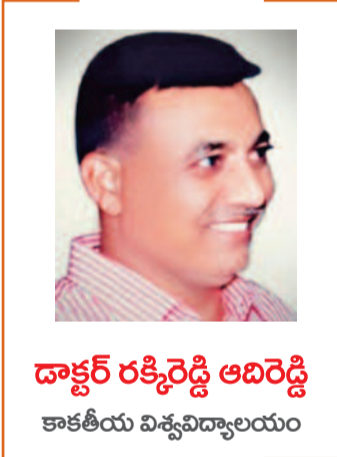
డాక్టర్ రకెడ్డి ఆదిరెడ్డి కాకతీయ విశ్వవిద్యాలయం

తెలంగాణ ప్రాంతంలో భాషా పరమైన మార్పులు సినిమా ప్రభావానికి ప్రత్యక్ష ఉదాహరణగా నిలుస్తున్నాయి. స్థానిక యాసల ప్రత్యేక గుర్తింపు ఉన్నప్పటికీ, సినిమాల్లో ఉపయోగించే మిశ్రమ తెలుగు శైలి కారణంగా యువత భాషలో మార్పులు వస్తున్నాయి. సర్వేలు ప్రకారం సుమారు 55% యువత సినిమా డైలాగ్ శైలిని రోజూవారి సంభాషణలో ఉపయోగిస్తున్నారు. ఇది స్థానిక భాషా స్వచ్ఛతపై ప్రభావం చూపుతోంది. ముఖ్యంగా పట్టణ ప్రాంతాల్లో ఈ ప్రభావం మరింత బలంగా ఉండగా, గ్రామీణ ప్రాంతాల్లో ఇది సుమారు 35% నుండి 40% వరకు విస్తరించినట్లు అంచనా. భాషా రూపాంతరం ఒకవైపు ఆధునికతను తీసుకువస్తున్నప్పటికీ, మరోవైపు స్థానిక గుర్తింపును బలపరచుతున్నట్లు పరిశోధకులు అభిప్రాయపడుతున్నారు. వేషధారణ విషయంలో కూడా సినిమా ప్రభావం స్పష్టంగా కనిపిస్తోంది. సుమారు 60% యువత సినిమా నటుల షాడోను అనుసరిస్తున్నట్లు అధ్యయనాలు సూచిస్తున్నాయి. దుస్తుల ఎంపిక, హెయిర్ స్టైల్, ప్రవర్తన శైలి వరకు సినిమా ప్రభావం విస్తరించింది. పట్టణ యువతలో ఈ ప్రభావం మరింత వేగంగా పెరుగుతూ ఆధునిక జీవనశైలిని ప్రోత్సహిస్తోంది. అయితే ఇది సంప్రదాయ వేషధారణ తగ్గడం కూడా కారణమవుతోంది. గ్రామీణ ప్రాంతాల్లో