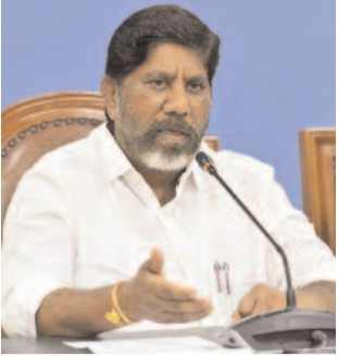
అసలు విషయం చిక్కటి పాండేలా ఈ వద్దకు ఆందగా నిలిచినట్లుగా. వైద్య రంగంలో వస్తున్న టెక్నాలజీ, టెలిమెడిసిన్,

మనోహర్ సింగ్ నాయకత్వంలో వచ్చిన జాతీయ గ్రామీణ ఆరోగ్య మిషన్, అశా వర్ష వ్యవస్థ గ్రామీణ ఆరోగ్య ముఖ్యమంత్రి మార్చివేసిందని గుర్తుచేశారు. వై.ఎస్ హయాంలో ప్రవేశపెట్టిన ఆరోగ్య శ్రీ పథకం పేదవాడి ఆరోగ్యానికి భరోసా ఇచ్చిందన్నారు. పేదరికం కారణంగా ఏ ఒక్కరూ చావుకు దగ్గర కాకూడదని కాంగ్రెస్ పార్టీ సిద్ధాంతానికి నిదర్శనమని అన్నారు. రూ. 5 లక్షల నుంచి రూ. 10 లక్షల వరకు ఉచిత వైద్య సాయం అందిస్తూ, గుండె, కిడ్నీ వంటి ఖరీదైన జబ్బులకు సైతం పేదవాడు ధైర్యంగా కార్పొరేట్