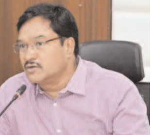
తెలంగాణ కోసం ఇక్కడి ప్రజలు కొట్లాడారు, ఆ ఆశయానికి అనుగుణంగానే ప్రభుత్వ ఆస్తులను రక్షిస్తున్నామని చెప్పారు. "రాష్ట్ర ప్రభుత్వం హైద్రాకు పూర్తి స్వేచ్ఛను ఇచ్చింది. మాకు రాజకీయ పార్టీలతో సంబంధం లేదు. ఎంఐఎం అయినా, అధికార కాంగ్రెస్ అయినా మాకు ఒకటే. ఫాతిమా కాలేజీ లాంటి విద్యాసంస్థలు భాగ్యనగరంలో చాలా ఉన్నాయి. చట్టం అందరికీ సమానమే. హైద్రా ఎప్పుడూ

హైదరాబాద్, జూన్ 20 (ఈవార్తలు): హైదరాబాద్ లో ఆక్రమణదారుల గుండెల్లో రైళ్లు పరిగెత్తిస్తున్న 'హైద్రాపై' గత కొన్ని రోజులుగా వ్యతిరేక ప్రచారం జరుగుతోందంటూ ఆ సంస్థ కమిషనర్ ఏపీ రంగనాథ్ తీవ్రంగా స్పందించారు. కొందరు పనిగట్టుకుని తమ సంస్థను బద్దాయించేయడానికి దుష్ప్రచారం చేస్తున్నారని మండిపడ్డారు. ఈరోజు హైదరాబాద్ లో నిర్వహించిన మీడియా సమావేశంలో ఆయన హైద్రా యాక్సన్ ప్లాన్, ఇప్పటివరకు సాధించిన విజయాలపై పక్కా తెక్స్ లతో క్లారిటీ ఇచ్చారు హైద్రా కేవలం కూల్చివేతలకే పరిమితం కాదేనని, ఇప్పటివరకు సిటీలో దాదాపు 600 ఆపరేషన్స్ పూర్తి చేసి, ఆక్రమణదారుల గుట్టల్లో ఉన్న సుమారు లక్షా పదివేల కోట్ల రూపాయల విలువైన ప్రభుత్వ ఆస్తులను, చెరువులను, పార్కులను హైద్రా కేవలం కాపాడమని రంగనాథ్ వెల్లడించారు. దౌర్బీదికి గురికాకుండా ఉండాలనే ఆకాంక్షతోనే ప్రత్యేక