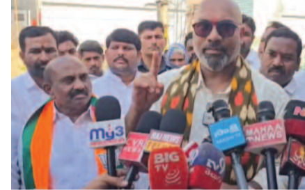
వెళ్తున్నాయో ప్రజలకు ప్రభుత్వం సమాధానం చెప్పాలని డిమాండ్ చేశారు. కేంద్రీయ విద్యాలయానికి కేటాయింపిన స్థలాన్ని కోట్ల రూపాయల లావాదేవీల కోసం ఒక ప్రైవేటు వ్యాపారికి అప్పగించారని

జగిత్యాల, జూన్ 16 (ఈవార్తలు): అమ్మతె 2 పథకం కింద జగిత్యాలకు రూ.38.5 కోట్లు, రాయకల్లకు రూ.15 కోట్లు మంజూరయ్యాయని, అయితే రాయకల్లలో పనులు ఇప్పటికీ ప్రారంభం కాకపోవడం ఆంధోళన కలిగిస్తోందని నిజామాబాద్ ఎంపీ ధర్మపురి అరవింద్ అన్నారు. జగిత్యాల సర్పంచ్లతో భాగంగా ఆయన మాట్లాడుతూ, రాయకల్ల అమ్మతె కాంట్రాక్టును సీఎం సన్నిహితుడికి చెందిన దమ్మి కంపెనీకి అప్పగించారని ఆరోపించారు. కమిషన్ కోసమే దమ్మి కంపెనీలకు పనులు కట్టబెడుతున్నారని, నటీ కాంట్రాక్టు ఇచ్చినప్పటికీ రాయకల్లలో ఇప్పటివరకు ఒక్క పని కూడా ప్రారంభం కాలేదని విమర్శించారు. అమ్మతె పథకం నిధులు ఎటు