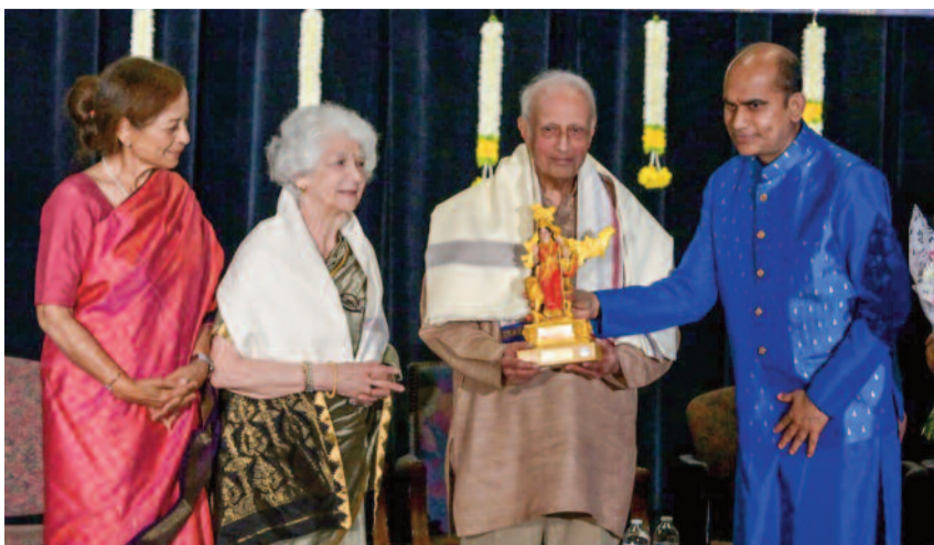
ఆంధోళన, ఒంటరితనం పెరుగుతున్నాయని, మహర్షుల జ్ఞానం నేటి సమాజానికి మార్గదర్శకుమని అన్నారు. ప్రతి ఒక్కరూ ఒక మహర్షి గురించి లోతగా తెలుసుకోవాలని, కుటుంబ సంప్రదాయాలను ఆచరించి భావితులకు అందించాలని విజయించారు. కనెక్టికట్కు చెందిన కుటుంబాలు దేశ విదేశాల నుంచి వచ్చిన అతిథులకు ఆత్మీయ ఆతిథ్యం అందించడంతో 'అతిథిదేవో భవ' భావనకు ప్రత్యేక రూపం కనిపించింది. మరో విశేషంగా, భారతీయత-2026 సందేశాన్ని న్యూయార్క్ నగరంలోని ప్రపంచ ప్రసిద్ధ ట్రైమ్ స్క్వేర్లో