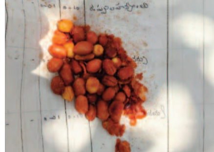
దుకాణదారుడు పొంతనలేని సమాధానమిచ్చారు. సాధారణంగా పహాణి వ్రుత్రాలు రెవెన్యూ శాఖ జారీ చేసే అధికారిక భూ రికార్డులు కావడంతో, అవి చిత్తు కాగితాలా ఎలా వినియోగంలోకి వచ్చాయనే ప్రశ్నలు

మల్కాలలో వెలుగుచూసిన విశిష్ట ఫుటల్ చిత్తు కాగితాలుగా వ్యవసాయ రికార్డులు విచారణకు గ్రామస్థుల డిమాండ్ మల్కాల, జూన్ 16 (ఈవార్తలు): సాధారణంగా వ్యవసాయ భూముల యాజమాన్యం, సర్వే నంబర్లు, పంటల వివరాలు, భూ విస్తీర్ణం వంటి అంశాలను నమోదు చేసే పహాణి వ్రుత్రాలు ప్రభుత్వ రెవెన్యూ రికార్డుల్లో కీలకమైనవి. అలాంటి అధికారిక వ్రుత్రాలను గుడాల అమ్మకాల కోసం వినియోగించిన ఫుటల్ జగిత్యాల జిల్లా మల్కాలంలో చర్చనీయాంశం శంకా మారింది. స్థానికంగా ఓ దుకాణంలో గుడాల విక్రయించిన సందర్భంగా, ఆ కాగితాలు ఎక్కడివని ఆరా తీయగా ఎక్కడో దొరికినట్లు సదరు