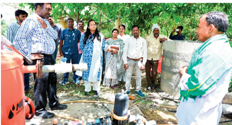
మెదక్ జూన్ 11:

మెదక్ జిల్లా శివపేట మండలం ఉసిరికపల్లి గ్రామంలో రైతు పోతరాజుల బాలెష్ సాగు చేస్తున్న సేంద్రియ వ్యవసాయ క్షేత్రాన్ని జిల్లా కలెక్టర్ ప్రతిమా సింగ్ పరిశీలించారు. సేంద్రియ పద్ధతుల్లో సాగు చేస్తున్న వరి, కూరగాయలు, పండ్ల తోటలను సందర్శించి రైతులతో మాట్లాడారు. సేంద్రియ వ్యవసాయం వల్ల నేల సారవంతం పెరగడంతో పాటు పర్యావరణ పరిరక్షణ, ఆరోగ్యకరమైన ఆహార ఉత్పత్తి సాధ్యమవుతుందని కలెక్టర్ పేర్కొన్నారు. సేంద్రియ పంటలకు మార్కెట్లో మంచి డిమాండ్ ఉండటంతో రైతులు అధిక ఆదాయం పొందే అవకాశం ఉందన్నారు. సేంద్రియ సాగు విస్తరణకు ప్రత్యేక కార్యాచరణ రూపొందించి రైతులకు శిక్షణ, అవగాహన కార్యక్రమాలు నిర్వహించాలని వ్యవసాయ శాఖ అధికారులను ఆదేశించారు.