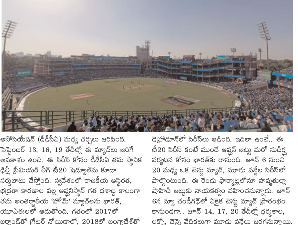
అసోసియేషన్ (ఐసీఐ) మధ్య చర్చలు జరిపింది. సెప్టెంబర్ 13, 16, 19 తేదీల్లో ఈ మ్యాచ్ లు జరిగే అవకాశం ఉంది. ఈ సిరీస్ కోసం డిడీసీవీ తమ స్థానిక ఢిల్లీ ప్రీమియర్ లీగ్ టీ20 మ్యాచ్ లు కూడా నర్దుటాలు చేస్తోంది. స్వదేశంలో రాజకీయ ఆస్తిరత, భద్రతా కారణాల వల్ల ఆఫ్ఫినిస్ గత దశాబ్ద కాలంగా తమ అంతర్జాతీయ 'హోమ్' మ్యాచ్ లను భారత్, యూఏఈలలో ఆడుతోంది. గతంలో 2017లో ఐర్లాండ్ లో గ్రేటర్ నోయిడాలో, 2018లో బంగ్లాదేశ్ లో

క్రికెట్ చరిత్రలో ఒక అరుదైన, ఆసక్తికరమైన ఘట్టానికి రంగం సిద్ధమవుతోంది. ఆఫ్ఫినిస్ క్రీకెట్ జట్టు తొలిసారిగా టీమిండియాకు అతిథ్యం ఇవ్వబోతోంది. అయితే విశేషం ఏమిటంటే.. ఈ చారిత్రక 'హోమ్' సిరీస్ కు వేదికగా నిలవబోయేది కూడా భారత దేశమే. ఈ ఏడాది సెప్టెంబర్ లో ఢిల్లీలోని అరుణ్ జైట్లీ స్టేడియంలో మూడు టీ20 మ్యాచ్ లు సిరీస్ ను నిర్వహించేందుకు ప్రణాళికలు జరుగుతున్నాయి. బీసీఐ, ఆఫ్ఫినిస్ క్రీకెట్ బోర్డు (ఐసీఐ) మధ్య ఉన్న బలమైన స్నేహపూర్వక సంబంధాల నేపథ్యంలో ఈ సిరీస్ సాధ్యమవుతోంది. రిటర్న్ టూర్ లో భాగంగా ఈ సిరీస్ ను నిర్వహించాలని ఏసీఐ చేసిన ప్రతిపాదనకు బీసీఐ సూక్ష్మప్రాయంగా అంగీకరించింది. ఇరు బోర్డుల మధ్య ఇప్పటికే ఒక అవగాహన కుదిరిందని, లాంఛనాలు పూర్తయిన తర్వాత అధికారిక ప్రకటన వెలువడుతుందని బీసీఐ వర్గాలు తెలిపాయి. ఐర్లాండ్, శ్రీలంక, జింబాబ్వే వంటి బోర్డులకు ఆర్థికంగా, క్రీడాపరంగా అందగా నిలిచేందుకు బీసీఐ గతంలోనూ ఇటువంటి సిరీస్ లు నిర్వహించిన విషయం తెలిసిందే. ఈ సిరీస్ కోసం వేదికను ఖరారు చేసేందుకు బీసీఐ యొక్క చొరవ తీసుకుని ఏసీఐ, ఢిల్లీ అండ్ దిల్లీ క్రీకెట్