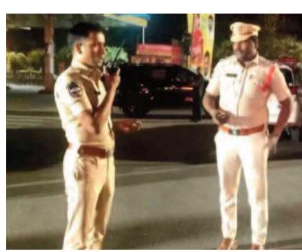
అర్ధరాత్రి ఎస్పీ ఆకస్మిక పేట్రోలింగ్