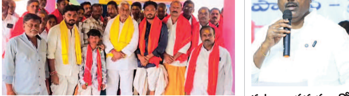
అవకాశం ఉంటుందని పేర్కొన్నారు. రైతులు గ్రామీణ ప్రాంతాల్లో ధాన్యం విక్రయాల్లో ఇబ్బందులు ఎదుర్కొంటున్నారని, గ్రామీణ ప్రాంతాల అభివృద్ధి, రైతు కుటుంబాల సంక్షేమంపై ప్రభుత్వాల దృష్టి సారించాలని సూచించారు. హబ్బిపూర్ ముదిరాజ్ సోదరులు ఆహ్వానించి పెద్దమ్మ తల్లి ఆశీర్వాదాలు పొందే అవకాశం కల్పించినందుకు వారికి కృతజ్ఞతలు తెలిపారు.