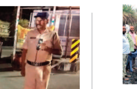
అగ్ని ప్రమాదంలో 2000 వేల ఈత చెట్లు బుగ్గి

జగిత్యాల, మే 22 (ఈవార్తలు): జగిత్యాల జిల్లాలో శాంతిభద్రతల పరిరక్షణ కోసం రాత్రి వేళ నిఘాను మరింత బలోపేతం చేస్తున్నట్లు జిల్లా ఎస్పీ అశోక్ కుమార్ ఐపీఎస్ తెలిపారు. అసాంఘిక కార్యకలాపాలు, చట్టవ్యతిరేక చర్యలు, దొంగతనాలను అరికట్టేందుకు బ్లా క్లోజ్, పెట్రోకార్ వాహనాలతో నిరంతర గన్నీ నిర్వహిస్తున్నారమని పేర్కొన్నారు. అలాగే నైట్ బీట్ వ్యవస్థను మరింత సమర్థవంతంగా అమలు చేస్తున్నట్లు వెల్లడించారు. ఈ నేపథ్యంలో గురువారం అర్ధరాత్రి ఒంటి గంట సమయంలో ఎస్పీ జగిత్యాల, కోర్ట్ల, మేడిపల్లి ప్రాంతాల్లో ఆకస్మికంగా పర్యటించి పెట్రోలింగ్ విధానాన్ని స్వయంగా పరిశీలించారు. విధుల్లో ఉన్న పోలీసు సిబ్బందితో మాట్లాడి పలు సూచనలు చేశారు. రాత్రి వేళలో అసమానుస్తర వ్యక్తులు, వాహనాలపై ప్రత్యేక నిఘా ఉండాలని, ప్రజలకు ఎలాంటి ఇబ్బందులు కలగకుండా అప్రవృత్తంగా విధులు నిర్వహించాలని ఆదేశించారు. ఈ సందర్భంగా ఎస్పీ మాట్లాడుతూ, రాత్రి సమయంలో సమర్థవంతమైన పెట్రోలింగ్ ద్వారా ప్రజల్లో భద్రతాభావాన్ని పెంపొందించడమే జిల్లా పోలీసుల ప్రధాన లక్ష్యమన్నారు. సమయానుకూలంగా స్పందించడం ద్వారా నేరాలను ముందుగానే అరికట్టే అవకాశం ఉంటుందని తెలిపారు. ముఖ్యంగా దొంగతనాలు, అసాంఘిక కార్యకలాపాలు, చట్టవ్యతిరేక చర్యలను నియంత్రించేందుకు రాత్రి నిఘాను మరింత పటిష్టం చేసినట్లు పేర్కొన్నారు. జిల్లాలో ప్రజలు ప్రశాంత వాతావరణంలో జీవించేందుకు అన్ని రకాల భద్రతా చర్యలు తీసుకుంటున్నామని, ఎలాంటి అసమానుస్తర ఘటనలు గమనించినా వెంటనే పోలీసులకు సమాచారం అందించాలని ప్రజలకు విజ్ఞప్తి చేశారు.