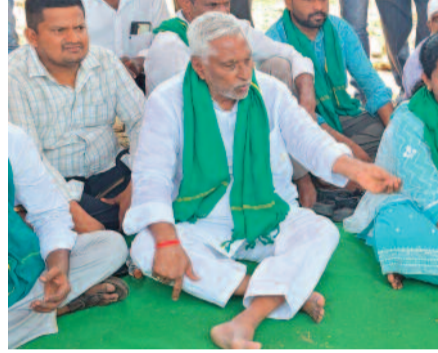
బాధ్యత అధికారులపై ఉండవచ్చు. చెరువులను ఆక్రమణల నుంచి వెంటనే విముక్తి చేయాలని, లేకపోతే ప్రజా ఉద్యమాలు మరింత ఉధృతం చేస్తామని హెచ్చరించారు. మాజీ ముఖ్యమంత్రి కే. చంద్రశేఖర్ రావు చేపట్టిన మిషన్ కాకతీయ కార్యక్రమం ద్వారా రాష్ట్రంలోని చెరువుల పునరుద్ధరణకు విశేష కృషి