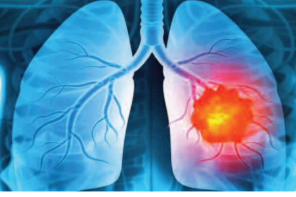
బెస్సెంట్రిక్: చర్మం కింద ఇచ్చే ఈ సబ్యూటేనియస్ విధానం వల్ల రోగులకు సమయం, శ్రమ రెండూ తగ్గుతున్నాయి. ముఖ్యంగా తీవ్ర అస్వస్థతలో ఉన్న రోగులకు ఇది ఎంతో ఉపశమనం కలిగించే అవకాశముంది. రోష్ సంస్థ వెల్లడించిన వివరాల ప్రకారం, ఈ కొత్త చికిత్స విధానం ద్వారా చికిత్స సమయం దాదాపు 80 శాతం వరకు తగ్గుతుంది. తరువాతి 2 వ పేజీలో...

ఉపరితీక్షణ క్యాన్సర్ రోగులకు ఇక అనువత్తుల్లో గంటల తరబడి కూర్చునే బాధ తగ్గుతుంది. ప్రపంచంలోనే తొలిసారిగా కేవలం ఏడు నిమిషాల్లో పూర్తి అయ్యే సబ్యూటేనియస్ ఇమ్యూనోథెరపీని స్విట్జర్లాండ్ కు చెందిన రోష్ ఫార్మా సంస్థ భారతదేశంలో ప్రారంభించింది. లంగ్ క్యాన్సర్ చికిత్సలో ఇది ఒక పెద్ద ముందడుగుగా వైద్య రంగం భవిష్యత్తుంది. ఇప్పటివరకు క్యాన్సర్ ఇమ్యూనోథెరపీ కోసం రోగులు గంటల పాటు అనువత్తుల్లో ఉండాల్సి వచ్చేది. అయితే ఇప్పుడు "బెసెంట్రిక్ ఎస్సీ" అనే కొత్త ఔషధంతో కేవలం ఏడు నిమిషాల్లోనే చికిత్స పూర్తవుతుంది.