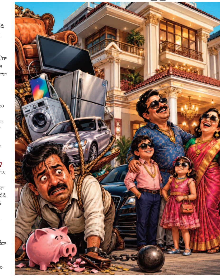
మరుసటి రోజు నుంచే వాటి విలువ సగానికి పడిపోతుంది. భవిష్యత్తును పణంగా పెట్టి, వర్తమానంలో తాత్కాలిక ఆనందాలను కొనుగోలు చేస్తున్నామన్న సత్యాన్ని గ్రహించాలి.

భవిష్యత్ తరాలకు ఇచ్చే సందేశం ఏంటి? తల్లిదండ్రుల జీవనశైలి పిల్లలకు తొలి పాఠశాల. అవసరానికి మించి అప్పులు చేసి, ఆస్కాటాలకు పోయే తల్లిదండ్రులను చూసి పెరిగి పిల్లలు కూడా అదే బాటలో పయనించే ప్రమాదం ఉంది. 'కష్టపడి సంపాదించడం, పొదుపు చేయడం, అవసరమైన మేరకు మాత్రమే ఖర్చు చేయడం' అనే క్రమశిక్షణను మనం వారికి నేర్పలేకపోతే, రేపటి తరం మరింత తీవ్రమైన ఆర్థిక సంక్షోభంలో చిక్కుకుంటుంది. గతంలో మధ్యతరగతి ప్రజలు తమ దగ్గర డబ్బులు ఉంటే భూమి, బంగారం లేదా ఫిక్స్డ్ డిపాజిట్ల రూపంలో దాచుకునేవారు. కాలక్రమేణా వాటి విలువ పెరిగి భవిష్యత్తుకు ఫోటో ఇచ్చేది. కానీ ఇప్పుడు లక్షల రూపాయలు పెచ్చింది కొంటున్న ఎలక్ట్రానిక్ గ్యాడ్జెట్స్, ఇంటీరియర్స్, ఖరీదైన వాహనాలు అన్నీ 'డిడిసియేషన్' (విలువ పడిపోయే) వస్తువులే. కొన్న