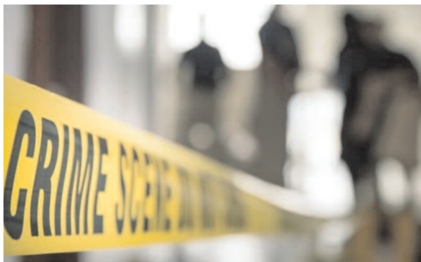
గుర్తించారు. వారు ముంబైలో ఉన్నట్లు నిర్ధారించుకుని స్థానిక పోలీసులను అప్రమత్తం చేశారు. అయితే, అక్కడి నుంచి తప్పించుకుని వారు తిరుపతి చేరుకున్నారు. వారి కడలికలను నిరంతరం గమనిస్తున్న రాజాం పోలీసులు, తిరుపతి పోలీసుల

4న పథకం ప్రకారం తన స్నేహితుడిని ఇంటికి పిలిపించారు. ఆ సమయంలో ఇంట్లో తల్లికి ఫోన్ చేసి రప్పించారు. తల్లి ఇంటికి రాగానే బాత్రూమ్ కు వెళ్తుండని ఊహించి, అక్కడే స్నేహితుడిని మాటు వేయమని సూచించారు. స్పందన బాత్రూమ్ లోకి వెళ్లగానే ఆమె స్నేహితుడు గట్టిగా పట్టుకోగా, ఇద్దరూ కలిసి రెండు చాకులతో ఆమె శరీరంపై సుమారు 15 సార్లు విచక్షణారహితంగా పొడిచి దారుణంగా హత్య చేశారు. అనంతరం బాత్రూమ్ లోని రక్తంపై మరకలను శుభ్రం చేసి, మృతదేహాన్ని ఇంటి వెనుక ఉన్న చెరువు వద్ద ముక్కాడలో వేడేశారు. ఇంట్లోని 9.5 తులాల బంగారం, రూ. 5 వేల నగదు, తల్లి మొబైల్ ఫోన్ తో పరారయ్యారు. ముంబై వెళ్లి మాఫియాలో చేరాలని లక్ష్యంతో ముందుగా పలానా చేరుకుని, అక్కడి నుంచి ముంబై వెళ్లారు. మృతురాలి కుటుంబ సభ్యుల ఫిర్యాదుతో రంగంలోకి దిగిన పోలీసులు, స్పందన శరీరంపై కత్తిపోట్లు ఉండటంతో హత్యగా నిర్ధారించారు. కొడుకు అదృశ్యం కావడంతో అతనిపై అసమానంతో దర్యాప్తు ముమ్మరం చేశారు. నిందితులు ఇన్స్ట్రాగ్రామల్లో స్నేహితులతో మాట్లాడటాన్ని సాంకేతిక ఆధారాలతో పోలీసులు