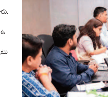
అభిప్రాయపడ్డారు. సల్తోండ - యాదగిరిగుట్ట మధ్య టెంపుల్ కారిడార్, ఆదిలాబాద్ - నాగోబా - బానర్ - కడెం ప్రాజెక్టులను కలుపుతూ టూరిజం కారిడార్ ఏర్పాటు చేయాలని అధికారులకు దిశానిర్దేశం చేశారు. కృష్ణా పుష్కలను దృష్టిలో ఉంచుకుని అలంపూర్ జోగలూరి అభివృద్ధి చేయాలని, మహబూబ్ నగర్ - భూత్పూర్ - జగద్దల ప్రాంతాలను కలిపి ఒక కారిడార్ గా, కొత్తగూడెం - పాల్యాం - సుజాతనగర్ కలిపి మరో కారిడార్ గా రూపొందించాలని సూచించారు.

మొదటి పేజీ తరువాయి కూడా కావాలే అయి ఉండాలని ఆదేశించారు. సాలిడ్ వేస్ట్ మేనేజ్మెంట్ ప్లాంట్లు, సీవర్జీడ్ డ్రైవ్ వ్యవస్థలతో కూడిన అర్బన్ ప్లానింగ్ ఉండాలని ముఖ్యమంత్రి పేర్కొన్నారు. మున్సిపాలిటీల్లో సోలార్ ఎనర్జీ ప్లాంట్లు ఏర్పాటు చేయాలని, పట్టణాలు, నగరాల్లో రేడియేషన్ తగ్గించడానికి మట్టి యుటిలిటీ టవర్లను నిర్మించాలని సూచించారు. ప్రతి బోట స్కార్ప్ పోల్ట్ ఉండాలని, ఆయా నగరాల జనాభాకు తగినట్లుగా స్టానికంగా డిజైన్ చేసుకోవాలని చెప్పారు. ట్రాఫిక్ నియంత్రణలో ఆర్టిఫిషియల్ ఇంటెలిజెన్స్ వినియోగంపై నిపుణులు సలహాలు తీసుకోవాలన్నారు. సీవర్జీడ్ అండ్ వేస్ట్ వాటర్ మేనేజ్మెంట్ బోర్డు నుంచి శుద్ధి చేసిన నీటిని భవన నిర్మాణాల్లో వాడేలా కఠిన నిబంధనలు తీసుకురావాలని సూచించారు. రాష్ట్రంలో ప్రత్యేక కారీదార్లను ఏర్పాటు చేయాలని సీఎం రేవంత్ రెడ్డి నిర్ణయించారు. వరంగల్ - కరీంనగర్ - ఖమ్మం కారిడార్ భవిష్యత్ తెలంగాణకు వెన్నెముకగా మారుతుందని ఆయన