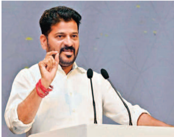
వెళ్లాలని ఈ సందర్భంగా సీఎం గుర్తు చేశారు. ఇక తెలంగాణ అభివృద్ధి కోసం తమ ప్రభుత్వం తయారు కేంద్రంలో, రాష్ట్రంలో అధికారంలో పార్టీలు వేరుగా ఉ చేసిన ప్రణాళికలను వివరిస్తామని వెల్లడించారు.

చెప్పారు. మీడియాతో సోమవారం చిట్చాట్ గా మాట్లాడిన సీఎం రేవంత్ రెడ్డి.. ఆదివారం రోజున ప్రధానమంత్రి నరేంద్ర మోదీ అధికారిక కార్యక్రమంలో రాష్ట్ర ప్రభుత్వం తరఫున తాను పాల్గొన్నట్లు వెల్లడించారు. ఇక తమతో కలిసి పనిచేయాలని ప్రధాని మోదీ ఇచ్చిన పిలుపులో ఎలాంటి రాజకీయాలు లేవని తేల్చి చెప్పారు. రాష్ట్రంలో అభివృద్ధి, సంక్షేమం కోసం.. కేంద్ర ప్రభుత్వంతో కలిసి వెళ్లేందుకు తనకు అభ్యంతరం లేదని రేవంత్ రెడ్డి స్పష్టం చేశారు. కేంద్ర ప్రభుత్వం ఇచ్చిన వికసిత్ భారత్ నివాదం లాగే తెలంగాణ ప్రభుత్వం ఇచ్చిన విజన్ 2047ను సాధించేందుకు.. తెలంగాణను 3 ట్రిలియన్ డాలర్ల ఆర్థిక వ్యవస్థగా మార్చేందుకు కేంద్ర ప్రభుత్వంతో రాష్ట్ర ప్రభుత్వం కలిసి నడుస్తుందని రేవంత్ రెడ్డి తేల్చి చెప్పారు. ఈ క్రమంలోనే సమాఖ్య వ్యవస్థలో కేంద్రం, రాష్ట్రాలు ఇచ్చిపుచ్చుకునే ధోరణి అవలంబించి.. ముందుకు